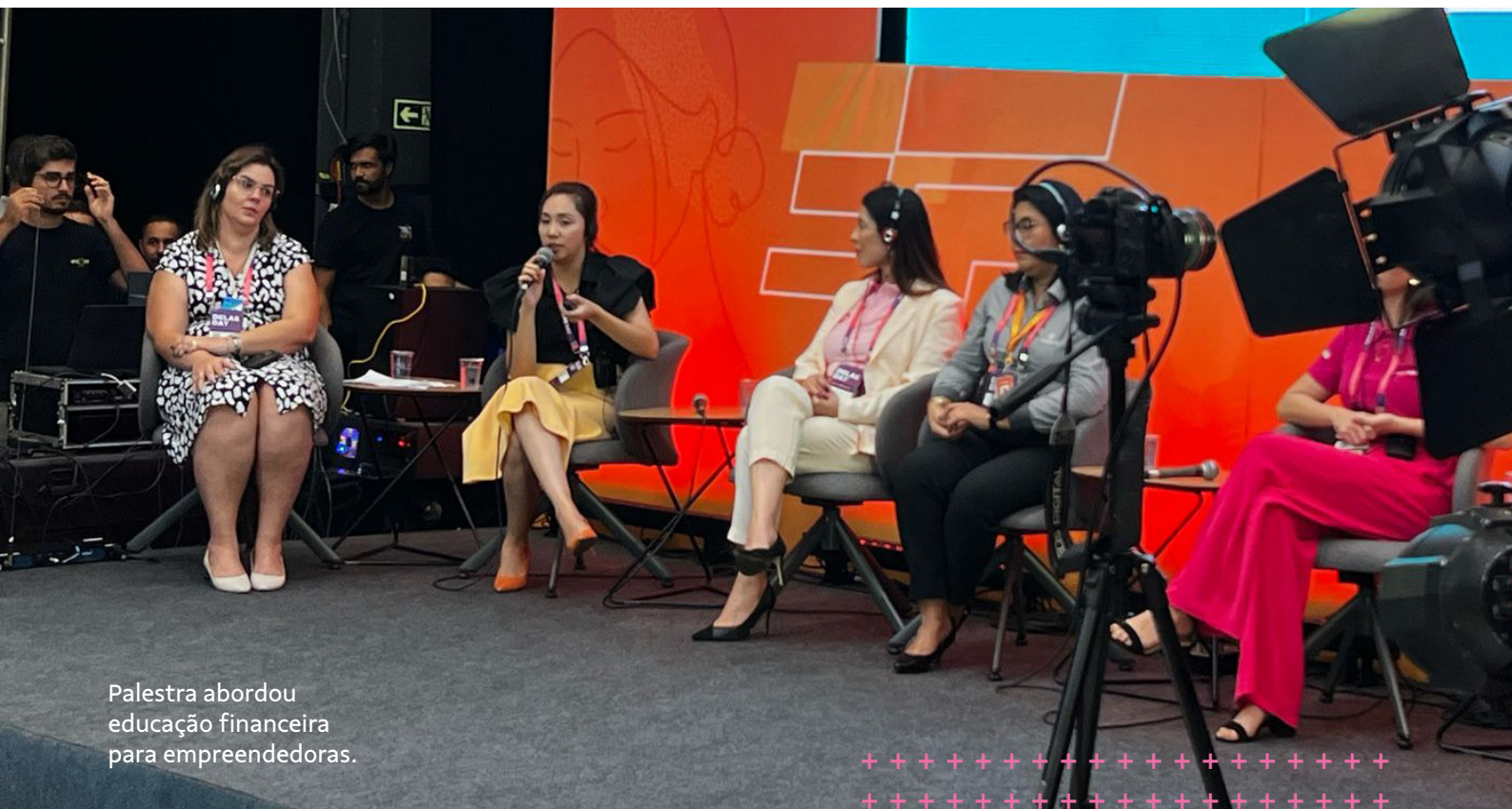
Palestra abordou educação financeira para empreendedoras.

Além disso, as participantes puderam conhecer mais sobre cooperativismo, empreendedorismo, planejamento financeiro e orçamento familiar.