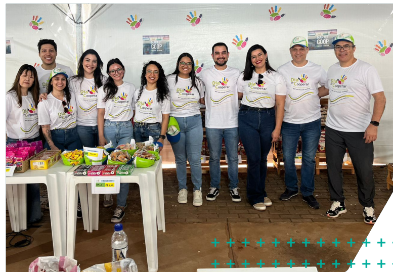
Dia C teve coleção Financinhas e Mercadinho do Cooperativismo

Mais de 300 pessoas, entre jovens, crianças e adultos, foram beneficiadas com atividades de educação financeira, por meio das histórias da coleção Financinhas, do Mercadinho do Cooperativismo e da apresentação artística do projeto Som & Vida.