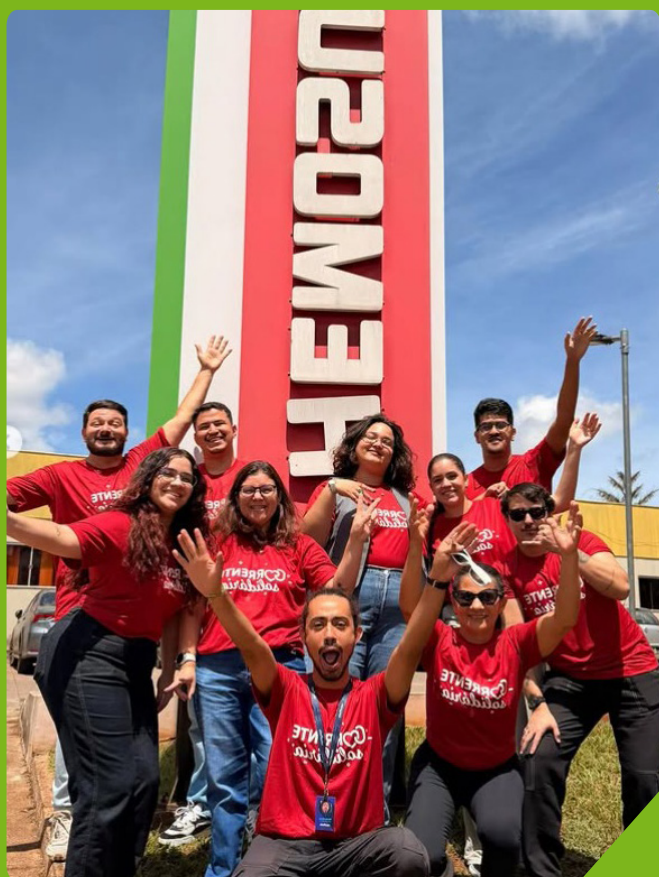
Instituto Sangue Bom trabalha em prol a doação de sangue, órgãos e transplantes de medula óssea