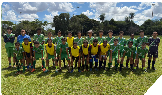
Projeto Redenção atende cerca de 100 crianças e jovens nas Moreninhas

Em 2025, o Instituto Sangue Bom realizou mais de 600 ações, alcançando cerca de 10 mil pessoas.