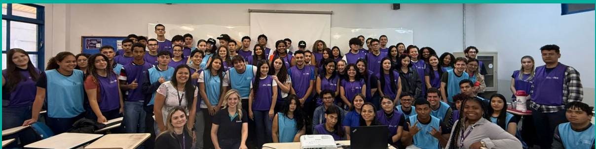
Programa se Liga Finanças teve 470 participantes em 2025