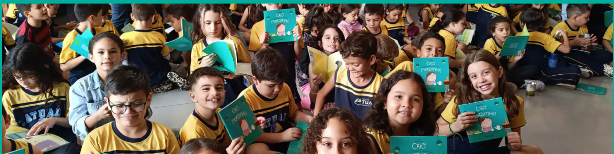
Alunos da Escola Atual, em Campo Grande (MS), durante atividades da coleção Financinhas

Os programas do Instituto Sicoob com maior alcance de público em 2025 foram: o programa Financinhas, que interagiu, por meio de sua coleção literária, com 3.812 crianças e jovens; seguido do programa Conhecimento em Foco, com a participação de 1.251 pessoas; e do programa Se Liga Finanças, com 470 participantes registrados.