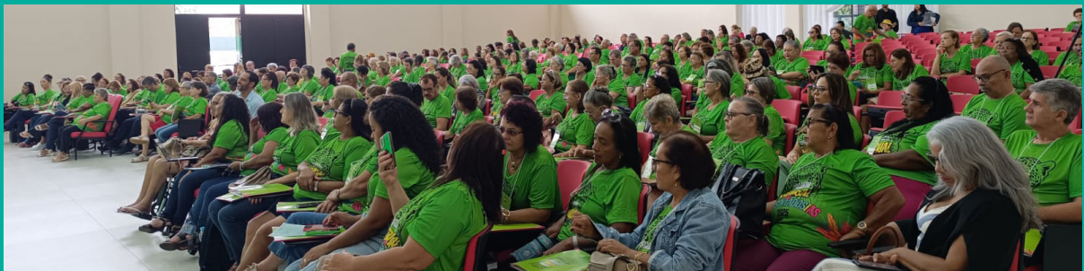
Programa Conhecimento em Foco, na Fetems, com 350 participantes