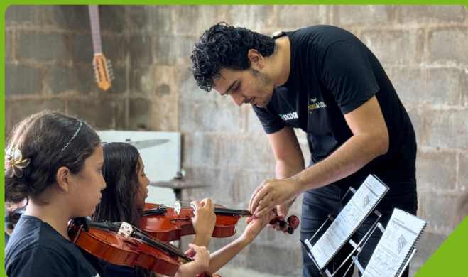
Projeto Som & Vida oferece novas oportunidades para 180 crianças e jovens