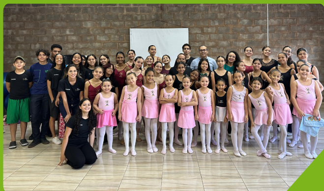
Projeto oferece musicalização, orquestra e balé no Bairro Universitário II