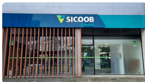
Agência Joinville Rua 9 de Março, nº 854 Joinville, Santa Catarina