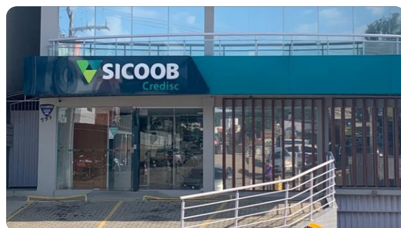
Agência Forquilha Rua Vereador Arthur Manoel Mariano, nº 799 São José, Santa Catarina