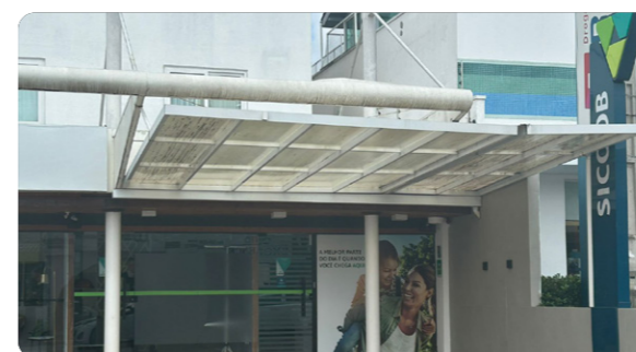
Agência Lagoa da Conceição Rua Afonso Delambert Neto, nº 740 Florianópolis, Santa Catarina