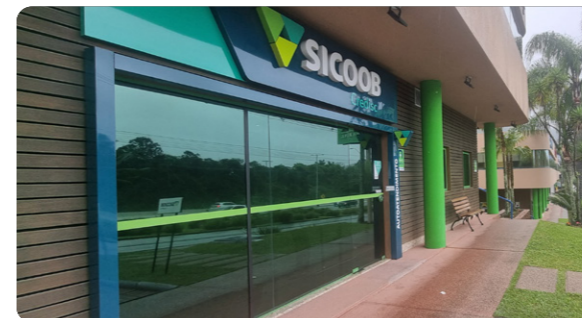
Agência SC 401 Endereço: Rodovia SC-401, Corporate Park, nº 8600 Florianópolis, Santa Catarina