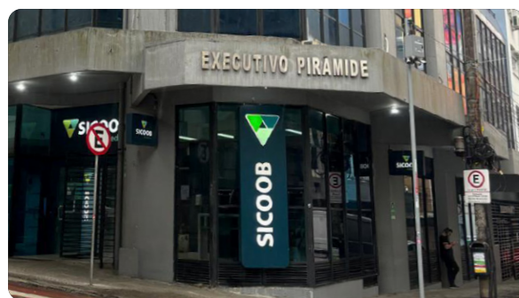
Agência Florianópolis - Sede Rua dos Ilhéus, nº 90, Florianópolis, Santa Catarina

A expansão geográfica não é um objetivo em si, é uma consequência do crescimento cooperativista. Abrimos onde fazemos sentido; permanecemos onde geramos valor.