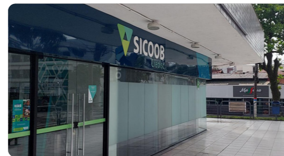
Agência Canasvieiras Endereço: Avenida Madre Maria Villac, nº 1089 Florianópolis, Santa Catarina