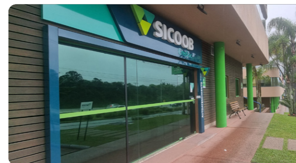
Agência SC 401 Endereço: Rodovia SC-401, Corporate Park, nº 8600 Florianópolis, Santa Catarina