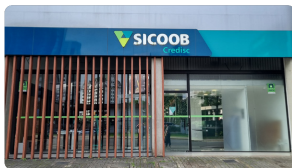
Agência Joinville Rua 9 de Março, nº 854 Joinville, Santa Catarina