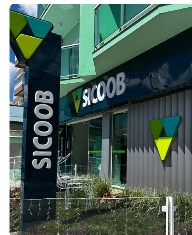
Avenida Adolfo Konder, 2580, Esquina, Urubici – SC