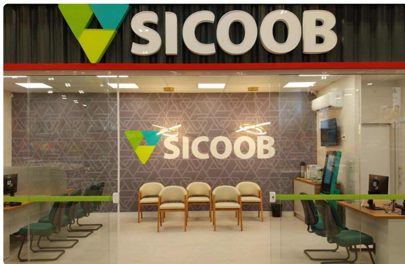
Av. Pedra Branca, 88, Palhoça – SC

Essa inauguração representa um marco importante para todos nós e, principalmente, para você que acredita na força da união e no cooperativismo. Cada nova agência é uma oportunidade de fortalecer nossa comunidade e aproximar soluções financeiras do seu dia a dia.