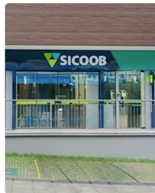
Rua Prefeito José Kehrig, 5417, Centro, Santo Amaro da Imperatriz – SC

As novas estruturas foram planejadas para oferecer ambientes modernos, acolhedores e funcionais, garantindo que nossos cooperados tenham uma experiência ainda mais confortável e um atendimento de excelência. Essas reinaugurações representam um passo significativo para fortalecer nossa presença e ampliar as soluções oferecidas a quem confia no Sicoob.