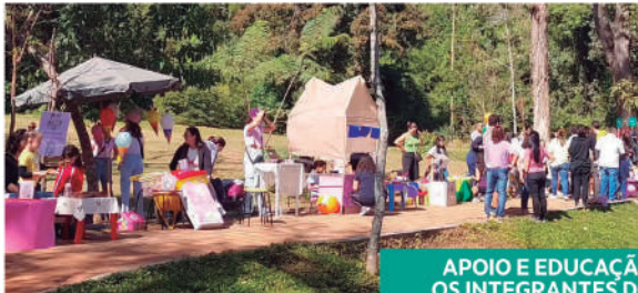
APOIO E EDUCAÇÃO FINANCEIRA COM OS INTEGRANTES DO PROJETO INFANTIL MERCADO DE PULGAS - TRÊS PONTAS