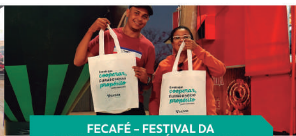
FECAFÉ – FESTIVAL DA CACHAÇA E DO CAFÉ – COQUEIRAL