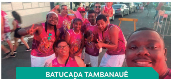
BATUCADA TAMBANAÚ TRÊS PONTAS