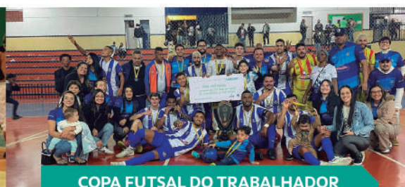
COPA FUTSAL DO TRABALHADOR DE TRÊS PONTAS