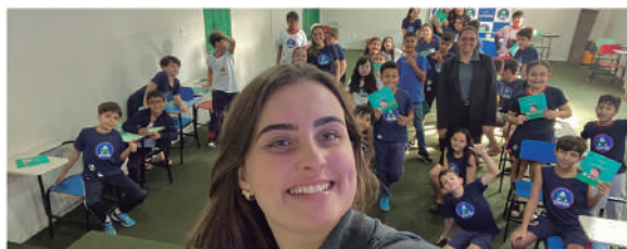
CONCURSO CULTURAL NEPOMUCENO