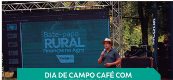
DIA DE CAMPO CAFÉ COM LEITE EPAMIG