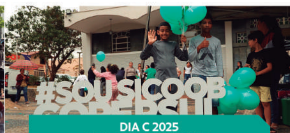
DIA C 2025 SANTANA DA VARGEM