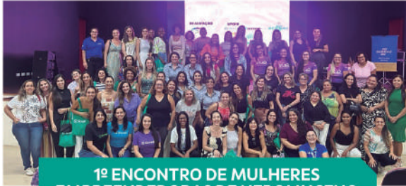
1º ENCONTRO DE MULHERES EMPREENDEDORAS DE NEPOMUCENO