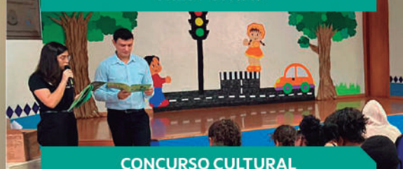
CONCURSO CULTURAL SANTANA DA VARGEM