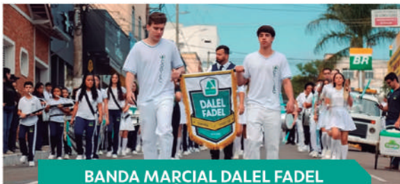
BANDA MARCIAL DALEL FADEL TRÊS PONTAS