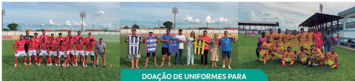
DOAÇÃO DE UNIFORMES PARA OS TIMES DE COQUEIRAL