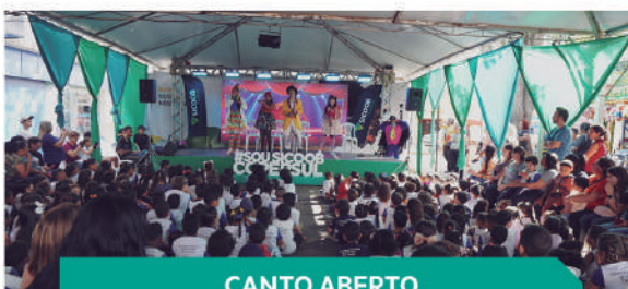
CANTO ABERTO TRÊS PONTAS