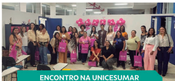
ENCONTRO NA UNICESUMAR DE NEPOMUCENO