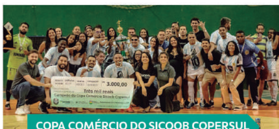
COPA COMÉRCIO DO SICOOB COPERSUL NEPOMUCENO