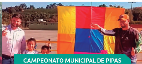
CAMPEONATO MUNICIPAL DE PIPAS COQUEIRAL