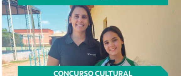
CONCURSO CULTURAL COQUEIRAL