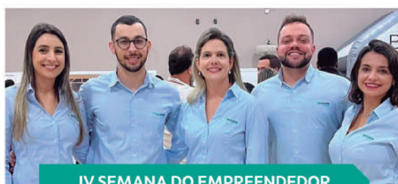
IV SEMANA DO EMPREENDEDOR NEPOMUCENO