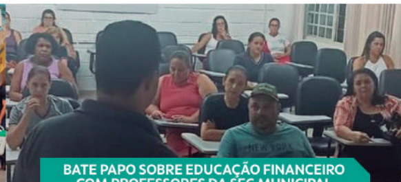
BATE PAPO SOBRE EDUCAÇÃO FINANCEIRO COM PROFESSORES DA SEC MUNICIPAL DE EDUCAÇÃO DE TRÊS PONTAS