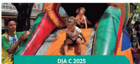
DIA C 2025 TRÊS PONTAS