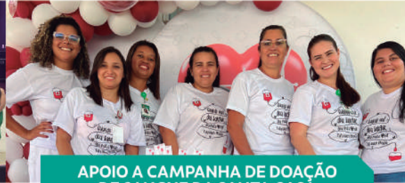
APOIO A CAMPANHA DE DOAÇÃO DE SANGUE DA SANTA CASA