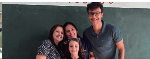
CONCURSO CULTURAL TRÊS PONTAS