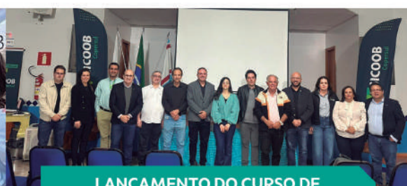
LANÇAMENTO DO CURSO DE ADMISTRAÇÃO – SANTANA DA VARGEM