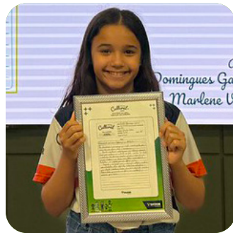
CATEGORIA TEXTO NARRATIVO