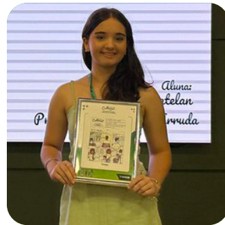
CATEGORIA TIRA EM QUADRINHOS