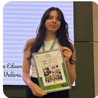
CATEGORIA TIRA EM QUADRINHOS