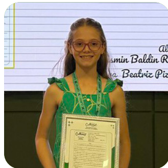
CATEGORIA TEXTO NARRATIVO