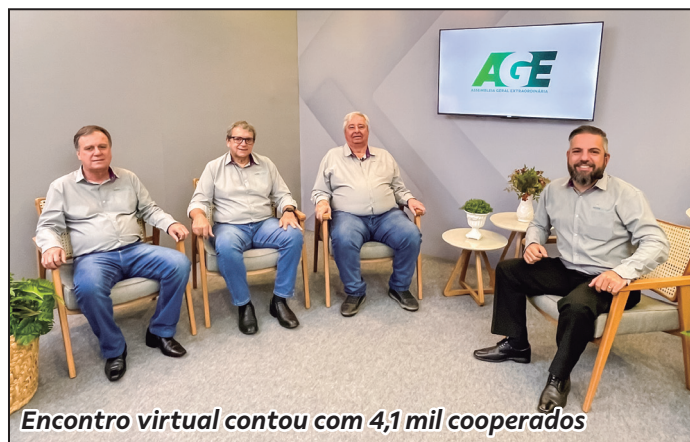
Encontro virtual contou com 4,1 mil cooperados

Com sucesso absoluto em número de votantes, Cooperativa aprova mudanças no Estatuto Social e atualizações de regulamento e de política institucional