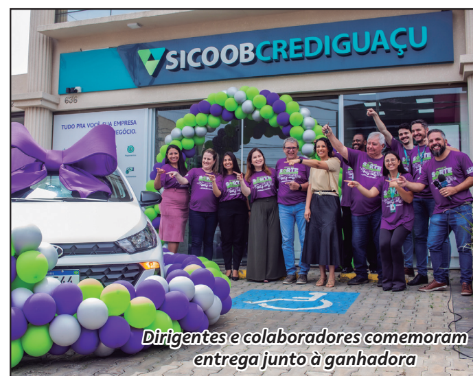
Dirigentes e colaboradores comemoram entrega junto à ganhadora

Associados que desejam participar, basta procurar sua agência para integralizar. Se preferir, os depósitos em conta capital podem ser feitos pelo App Sicoob. Para quem queira abrir sua conta no Sicoob Crediguaçu, procure uma de nossas agências e participe.