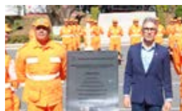
Posse Oficial do Complexo Pampulha CBMMG