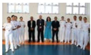
Abertura da Semana de Enfermagem HPM - PMMG