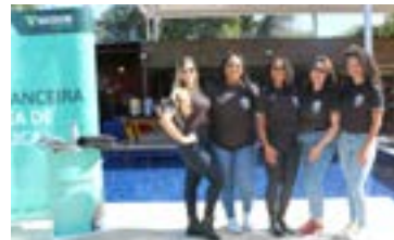
Encerramento das Olimpíadas 2º RPM PMMG