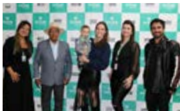
Arraiá do Comando de Policiamento de Meio Ambiente - CPMamb - PMMG