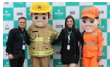
ARRAIÁ DO FOGO 2022 CBMMG