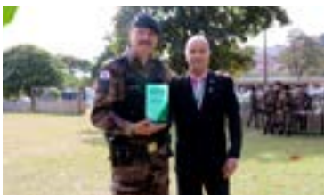
65 anos da ROCCA PMMG