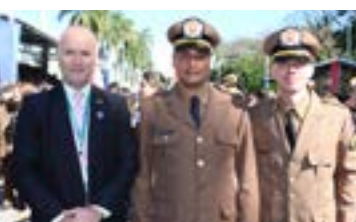
Formatura CEFS PMMG