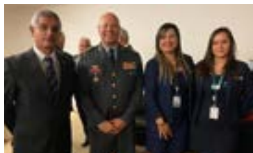
Medalha Dom Pedro II CBMMG