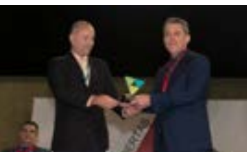
110 anos do DETRAN PCMG