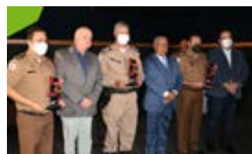
Lançamento da série: "A Segunda Pele" DCO - PMMG