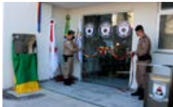
Inauguração da seção de assistência à saúde 66º BPM - PMMG