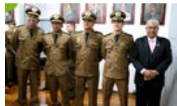
247 anos da Polícia Militar de Minas Gerais PMMG

Demais eventos 2º trimestre 2022: Inauguração do Espaço dos Veteranos 1º BBM | Janeiro Branco CBMMG | Passagens de comando: CPMamb, 5º RPM, APM, ARINS e CGC, CPE, DS e HPM, CPC e outros | Entrega de Medalhas da Diretoria de Saúde | Palestra para CFS CBMMG | Aniversário 1º BBM | Dia das Mulheres AFAS e 3º BBM | Palestra CFO 1 | Recepção dos novos soldados PMMG | Aniversário 11 anos da ABM | Aniversário 22 anos APM | Espadim CBM | Formatura CHO CBM | Palestra DAT | 100 anos do 5º BPM | 132 anos do 1º BPM | 15 anos do 48º BPM | Curso: Casal Grávido - AFAS | Despedida do Cel BM Ferreira | Inauguração sede AOPMBM | Lançamento do Período de Estiagem | Visita ao CTPM | Medalha Mérito Profissional APM PMMG | Reunião com a Marinha do Brasil BH | Dia do Veterano PMMG | Programa de Preparação para a Reserva - PPR CBBMG | dentre inúmeros outros em todo o Estado.