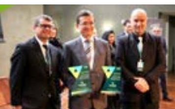
Troféu: "O Tira" Polícia Civil de Minas Gerais