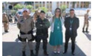
Encerramento do curso de Motopatrulhamento Especializado - PMMG