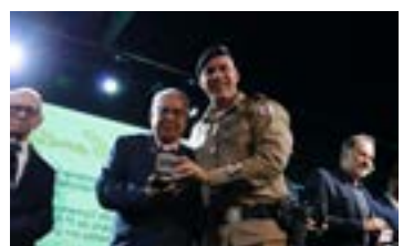
24 anos da 2ª RPM PMMG