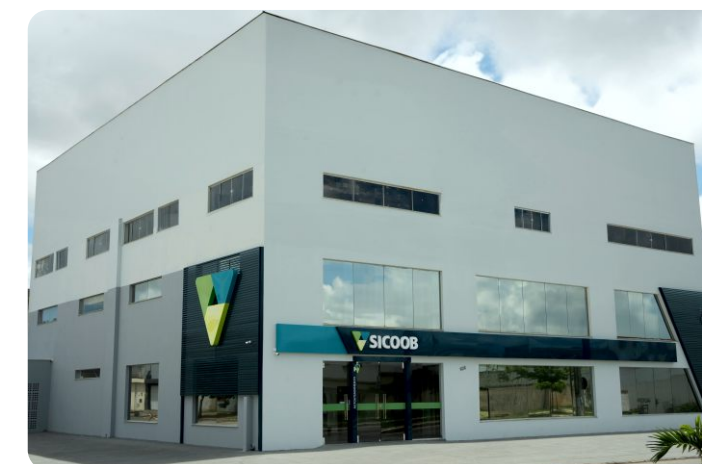
Vitória da Conquista – Av. Juracy Magalhães, Felícia

https://www.sicoob.com.br/web/sicoobcrediconquista