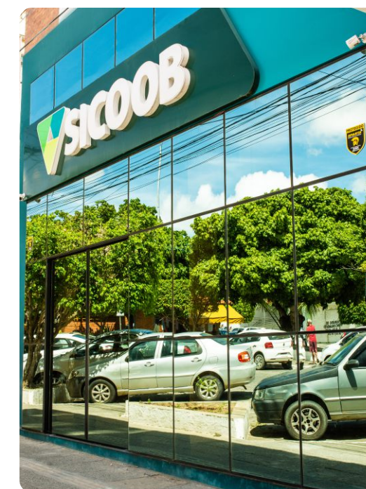
Itapetinga – Pça Augusto de Carvalho – Centro