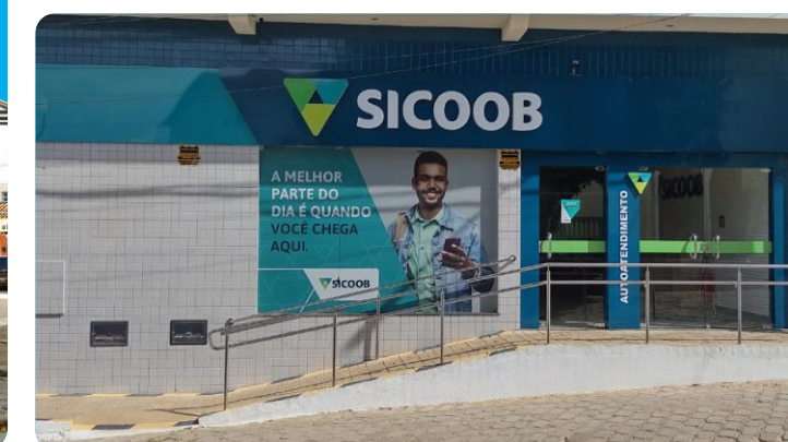
Tremedal – Praça Matriz, 17 – Centro