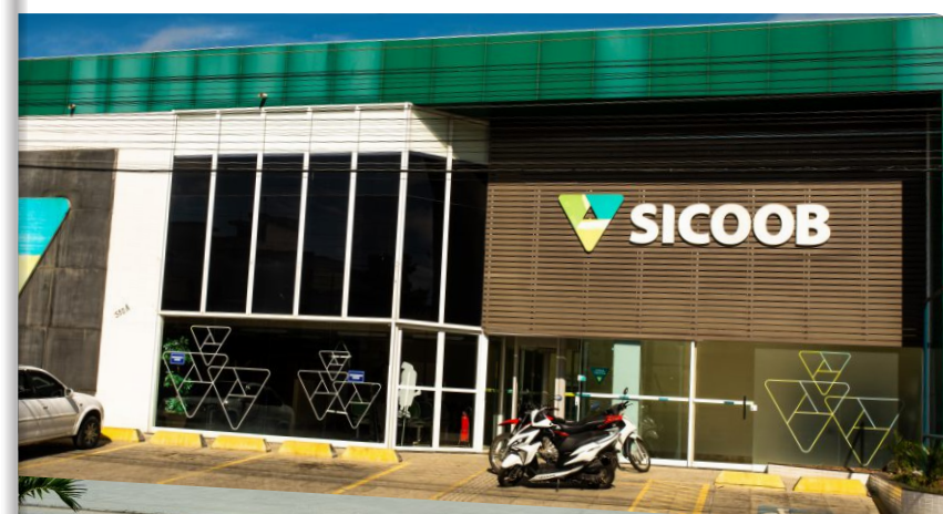
Vitória da Conquista – Av. Frei Benjamin – Patagônia