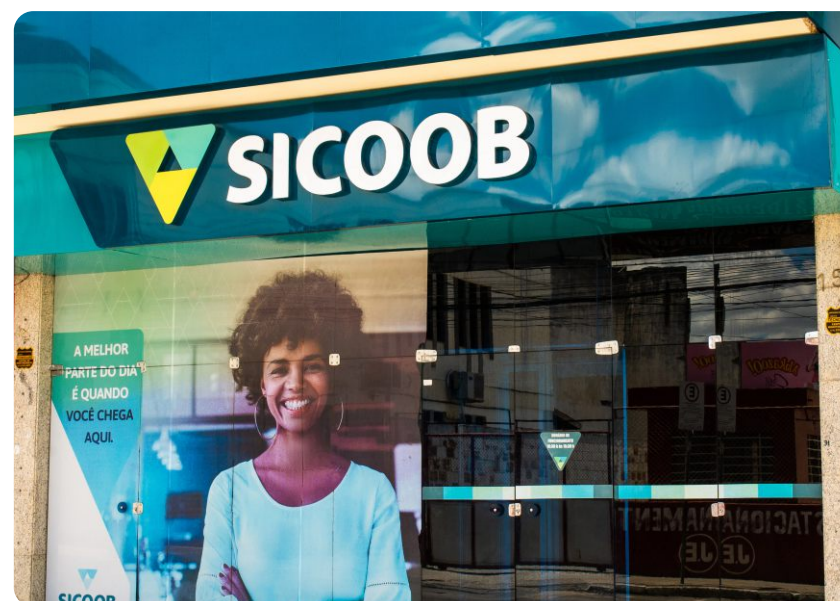
Vitória da Conquista – Rua Francisco Santos – Centro