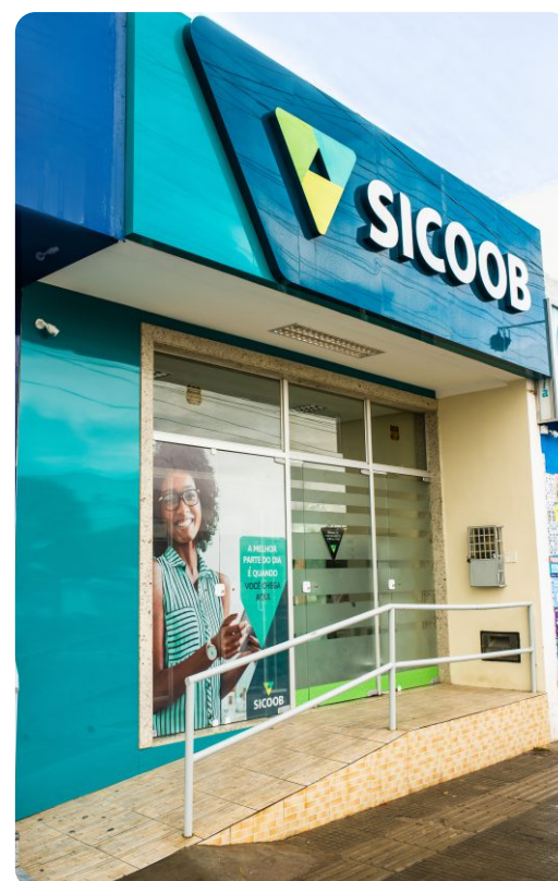
Poções – Pça. Coronel Raimundo Pereira de Magalhães, Centro