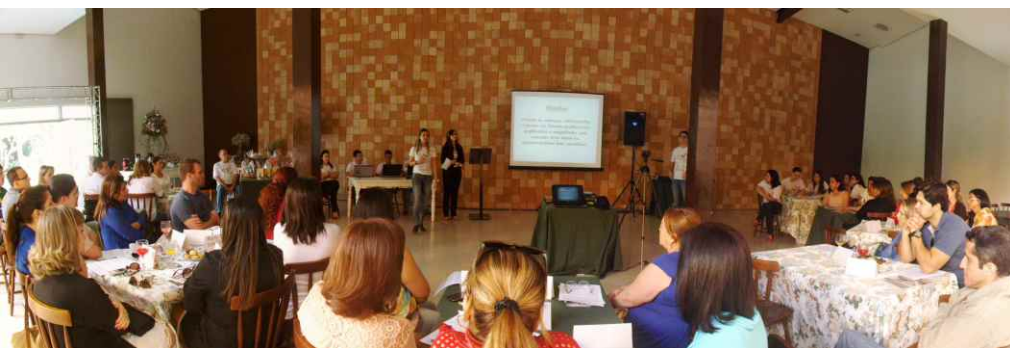
Diretores e colaboradores da Lagoacred, com o corpo docente, supervisão e direção das escolas da região, compareceram ao “Café Intelectual”, realizado pela Cooperativa de Crédito

A Diretoria da Lagoacred ficou satisfeita com o resultado deste Café Intelectual, pois, o público participante foi de elevado grau de conhecimento, o que veio enriquecer o debate sobre o tema “Educação Financeira” e de como pode ser aplicado para alcançar uma melhoria na vida dos alunos e de suas famílias. Além das informações e pontos de vistas coletados no evento, o Projeto Jovem Cooperativista teve a adesão voluntária de diversos educadores e jornalistas que estavam presentes, ganhando novos aliados e fortalecendo o seu propósito.