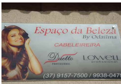
Placa na fachada do “Espaço da Beleza”

Gosto muito de trabalhar com a Lagoacred. Sempre uso e aceito o cartão Samonte Card. Minhas clientes também usam muito este cartão para minha surpresa, pois não imaginava que tanta gente tinha o hábito de pagar com o cartão de crédito da Cooperativa. Fico sempre atenta com as iniciativas da Lagoacred, pois sei que ela busca as melhores condições para seus cooperados e isso me dá a segurança e o apoio que preciso para lutar pelos meus sonhos.