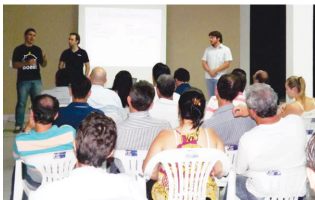
O evento despertou grande interesse dos empresários de Lagoa da Prata e região