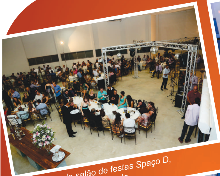
Panorâmica do salão de festas Espaço D, local da realização do evento