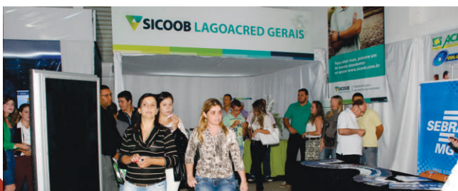
O stand da Lagoa-cred recebeu muitos visitantes