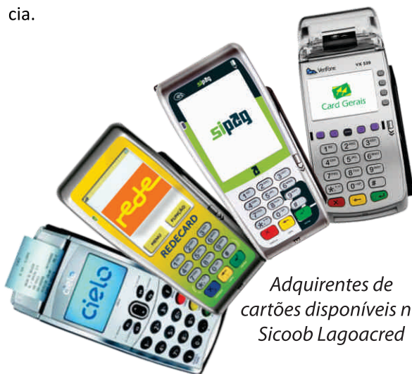
Adquirentes de cartões disponíveis no Sicoob Lagoacred

Sem dúvida alguma, estamos falando de um meio de pagamento que é cada vez mais utilizado pelas pessoas, principalmente pelos motivos relacionados na pesquisa. Os lojistas precisam estar preparados para esta realidade, ou serão atropelados pela concorrência.