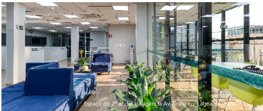
Espaço do 2º andar da agência Av. Brasil em Lagoa da Prata.