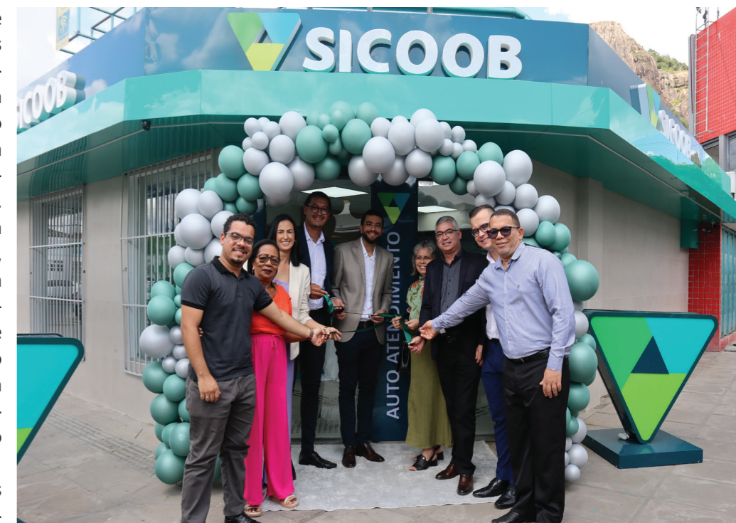
Inauguração em Tanquinho/BA

Durante os eventos, os discursos destacaram o impacto positivo da chegada