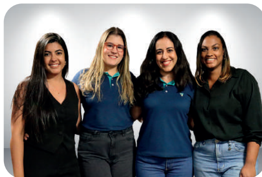
Posto de Atendimento Matriz