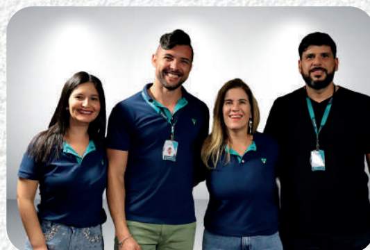
Unidade de Planejamento e Controle