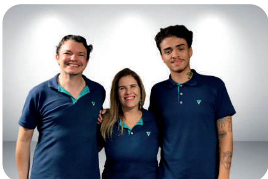
Unidade de Tecnologia da Informação