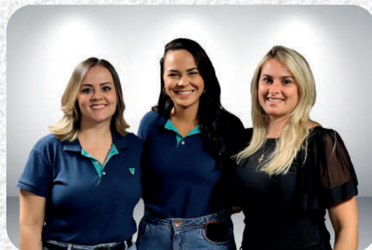
Posto de Atendimento Restrito TRE