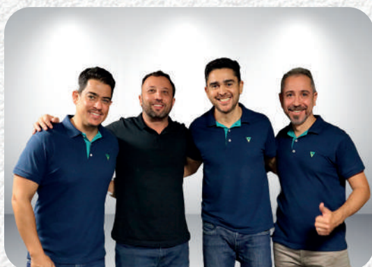
Unidade de Atendimento ao Cooperado - PJ