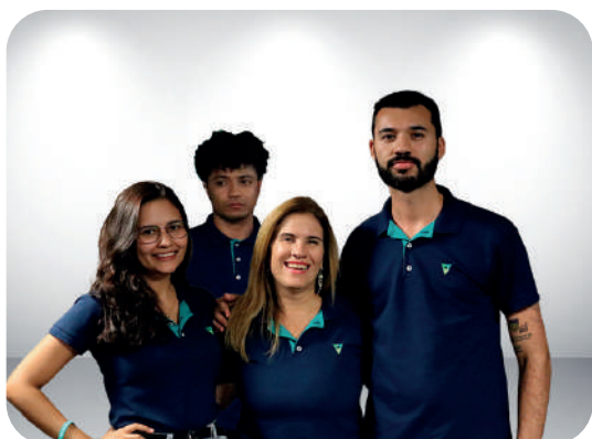
Unidade de Comunicação e Marketing