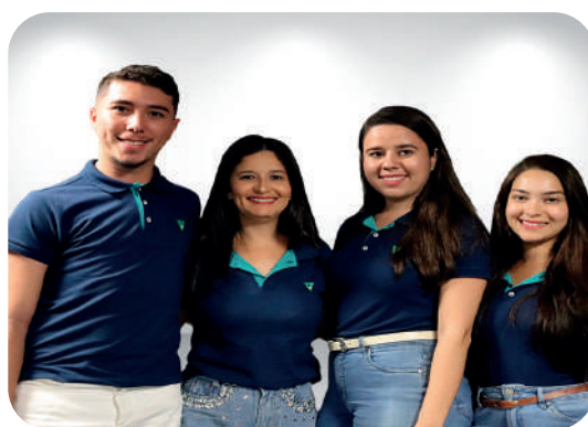
Unidade de Recuperação de Crédito