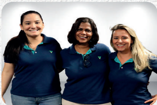
Posto de Atendimento Barro Preto