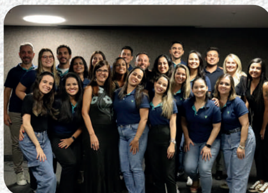
Equipe de Negócios