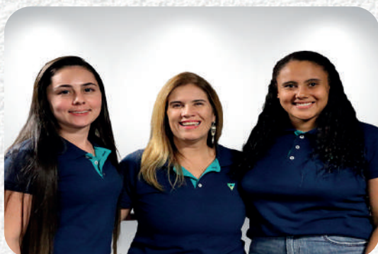
Unidade de Gestão de Pessoas