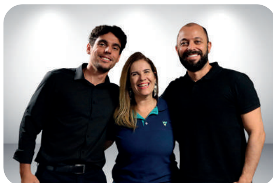
Unidade de Produtos e Serviços