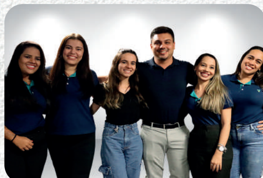
Multicanal/Núcleo do Interior