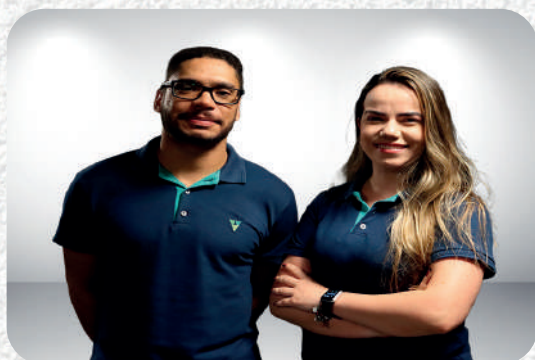
Unidade de Controle Interno