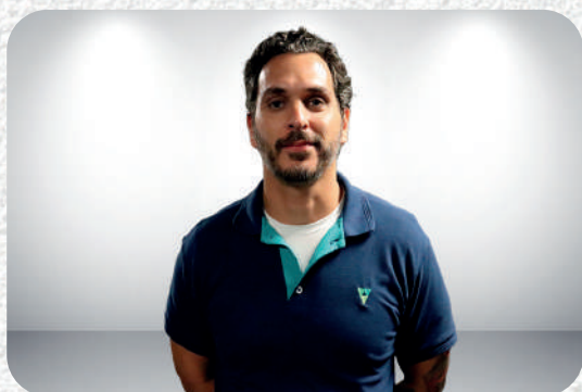
Posto de Atendimento Restrito TRF