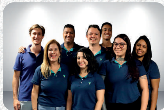
Unidade de Crédito/Vistoria/Cadastro