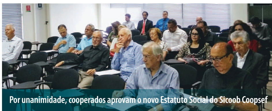
Por unanimidade, cooperados aprovam o novo Estatuto Social do Sicoob Coopsef

Política Nacional de Cooperativismo. Trata-se, portanto, de um dispositivo que começa agora a ser implementado em definitivo, como quer o Banco Central, tornando ainda mais profissional a gestão das cooperativas, acrescentou o assessor, destacando que este é o caminho que o Sicoob Coopsef está trilhando.