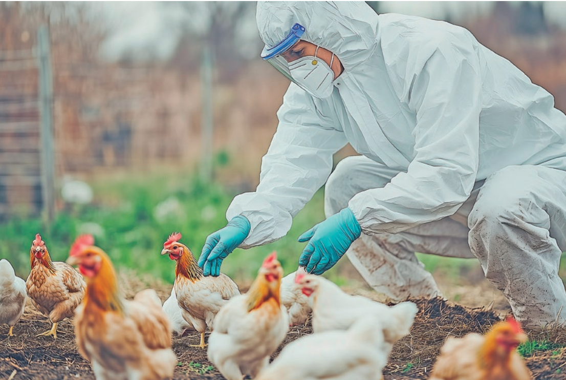
Surto de gripe aviária H7N9 foi detectado em uma granja avícola, enquanto país continua a enfrentar outra cepa da doença

Os departamentos de agricultura e saúde do Mississippi não responderam imediatamente aos pedidos de comentários. (Reuters) %