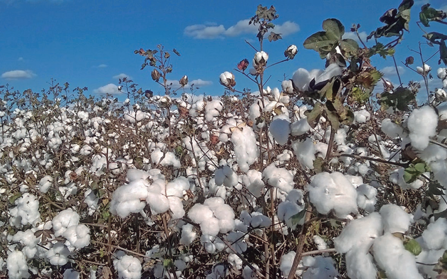
Sustentabilidade é uma característica forte no Proalminas; hoje, mais de 70% do algodão produzido em Minas tem certificação ABR, além da certificação internacional BCI

Nessas regiões, o foco é o mercado interno. “O produtor prefere vender aqui dentro, por meio do programa, pois ele consegue um ágio de 7,85%. Essas condições são até mais atrativas do que exportar. Além disso, a contrapartida da indústria têxtil é consumir 100% desse algodão, o que garante ao produtor vender a colheita”, explica Fernandes.