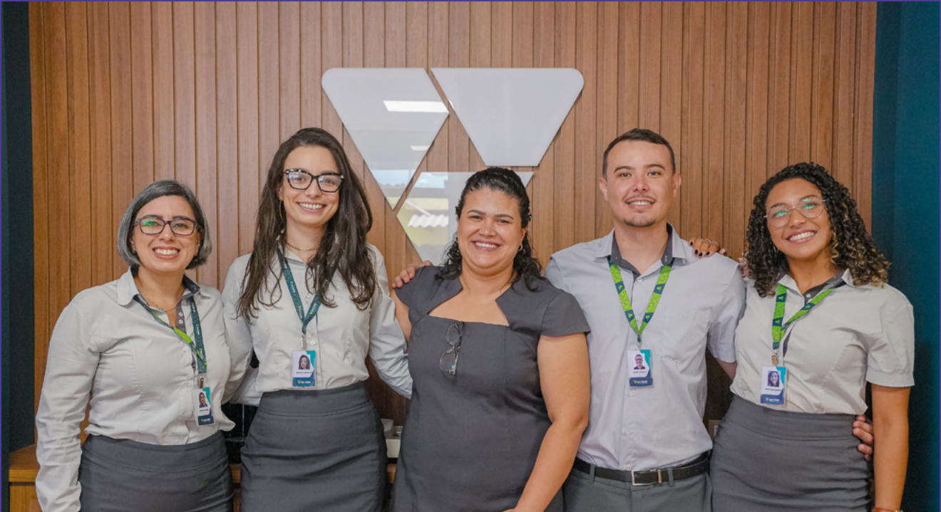
Equipe local agora recebe Cooperados em estrutura reformulada. Novo espaço reafirma compromisso com a Comunidade