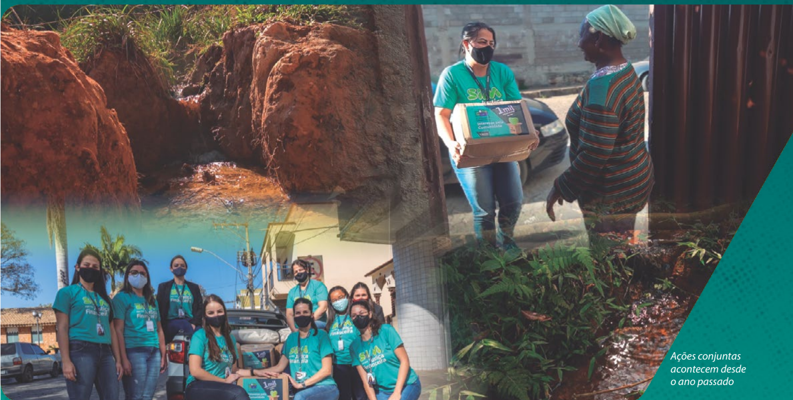
Ações conjuntas acontecem desde o ano passado

Vale lembrar que em 2020 e 2021 a iniciativa somou 14 mil metros de área cuidada em 22 propriedades de São Tiago, Resende Costa, Ritópolis, São João del-Rei, Prados e Coronel Xavier Chaves. Ou seja: até agora, 40 fontes de H 2 O foram isoladas com materiais sustentáveis e apoio técnico, garantindo fluidez e limpeza desses recursos hídricos desde o ponto em que brotam. Todos os investimentos nessa proposta, ultrapassando R$335 mil, foram custeados pelo Sicoob Credivertentes.