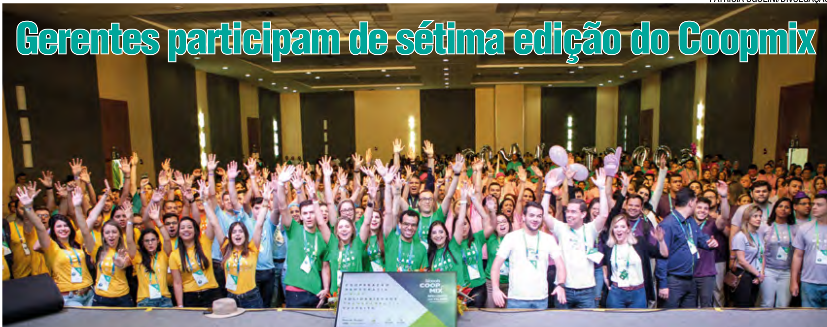
Evento ocorreu em Caeté e reuniu cooperativistas de todo o Estado

Uma vez a cada dois anos, mais de mil profissionais do Sistema Crediminas se reúnem no Coopmix , um evento de interação e aperfeiçoamento profissional que, em 2017, chegou à sétima edição. Sediado no Tauá Resort Caeté, o encontro ocorreu nos dias 24 e 25 de novembro, somando quase 24 horas de atividades entre palestras, painéis de produtos e serviços e até um Quiz do Conhecimento mediado por ninguém menos que o Celso Portliolli.