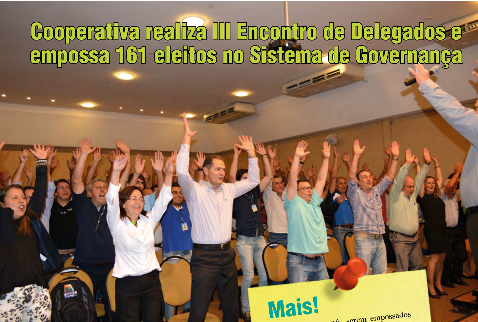
Evento contou com palestras motivacionais e treinamento sobre representatividade

O anfiteatro de um hotel em Barbacena, com 200 lugares, foi espaço suficiente para receber mais de 16 mil pessoas. Como? Através de representatividade.