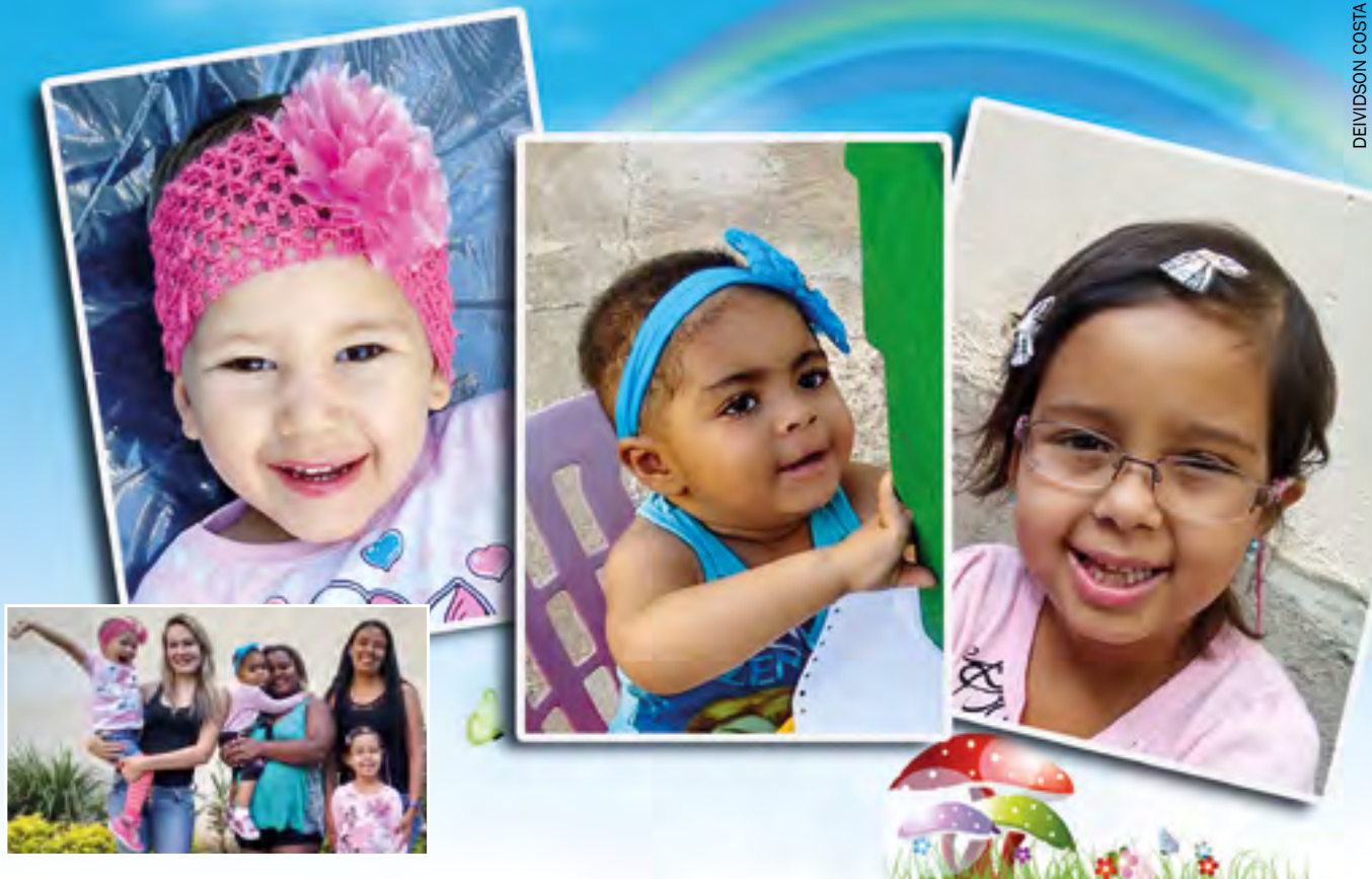
Pequenas guerreirinhas da Asapac ensinam lições de vida, superação, fé e alegria