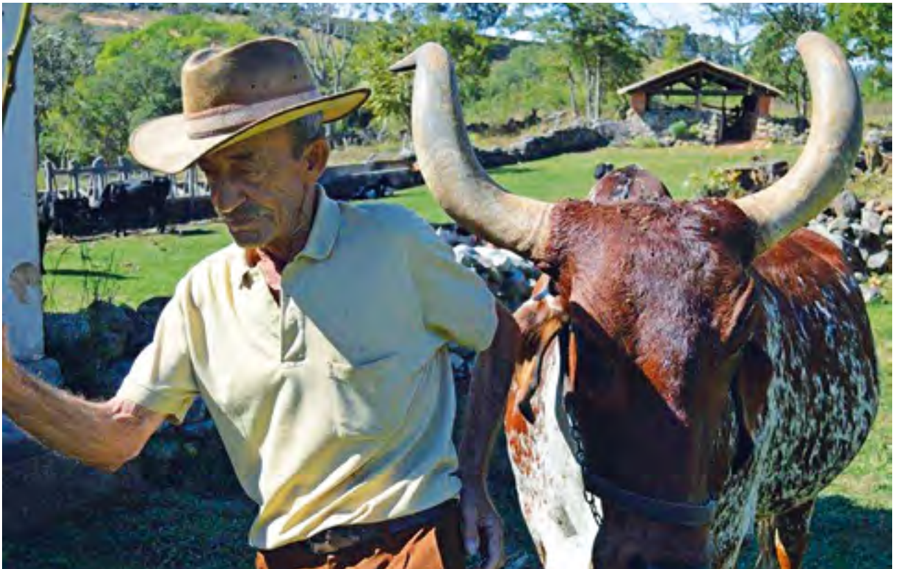
Parceria entre o fazendeiro e o boi de estimação virou notícia no país inteiro