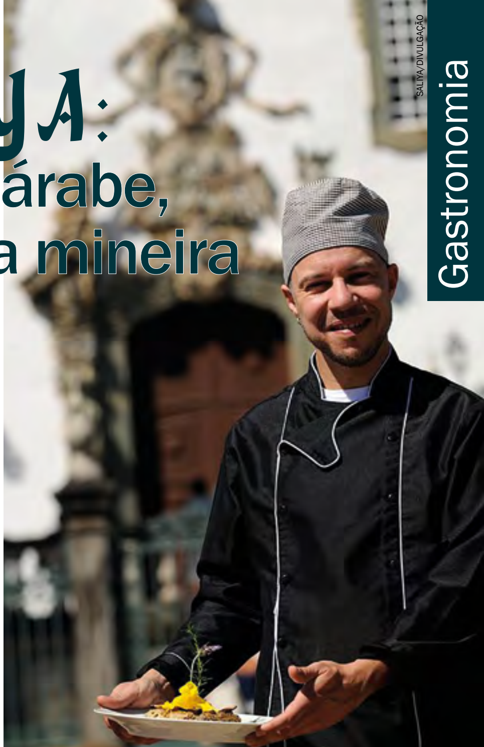
Restaurante referência no Campo das Vertentes oferece 50 maravilhas gastronômicas diferentes