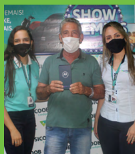
3º Prêmio José Evangélio Valadares 1 smartfone Motorola One Fusion 64 GB, Azul Safira