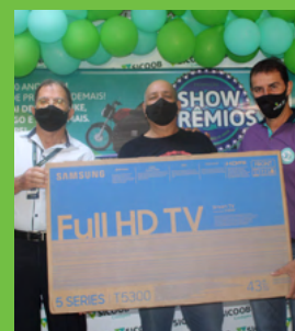
4º Prêmio Carlos Roberto dos Santos 1 TV 43" O LED FHD Samsung