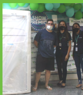
5º Prêmio Samuel Soares Santos 1 Refrigerador Doméstico CÔnsul 2 Portas 415 LT 127 V