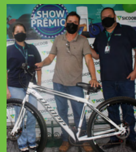
2º Prêmio Libério Ap. de Barros 1 Bicicleta Aro 29 DROPP Sport Aço 21v Marchas