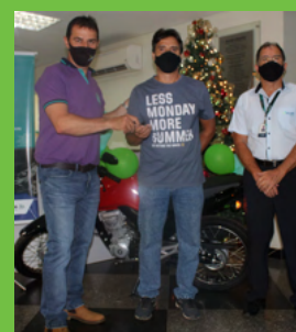
6º Prêmio Sérgio David de Araújo 1 Moto Honda CG 160 Start 2021/2022, 0 km