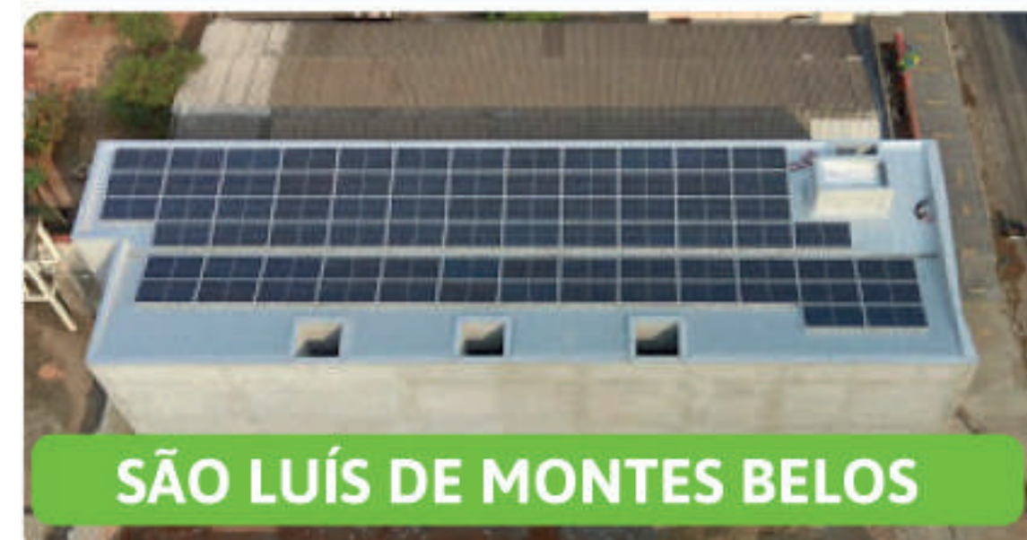
SÃO LUÍS DE MONTES BELOS