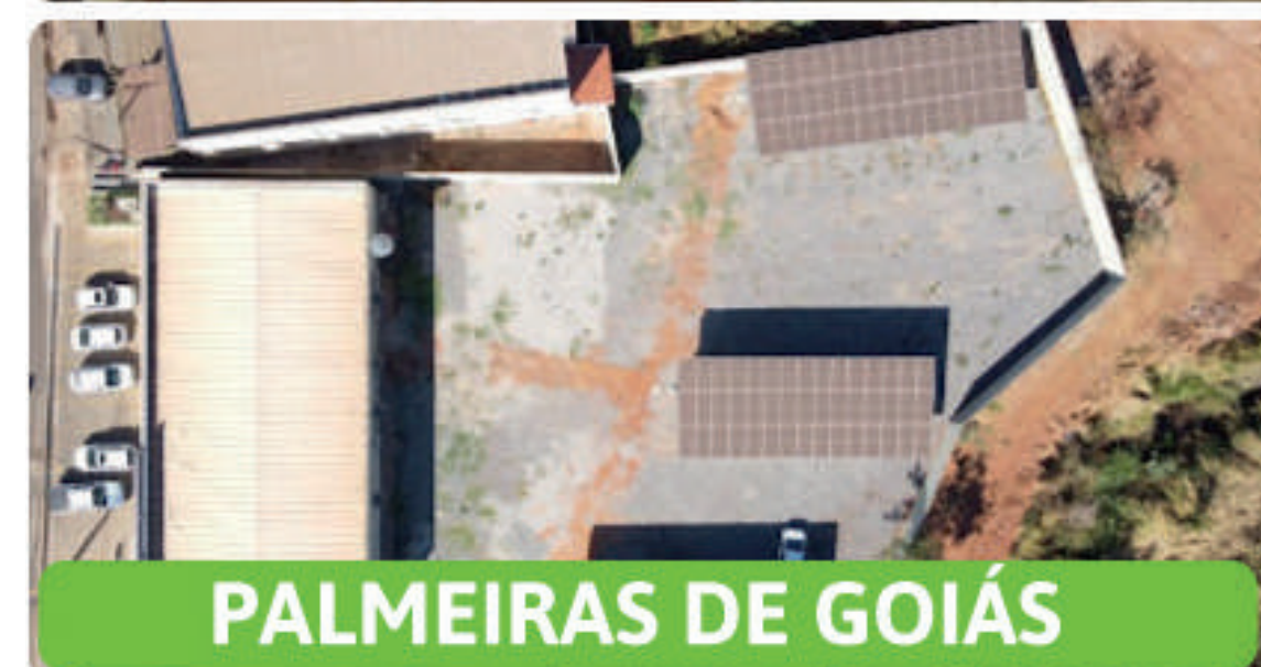
PALMEIRAS DE GOIÁS