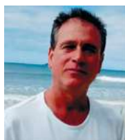
Texto de: Sérgio Bronzi

Desde o início do século o café é uma das mais importantes plantas cultivadas no Brasil; vindo da guiana francesa, entrou pelo norte do Brasil, desceu para a Bahia, Rio de Janeiro, e chegando às terras férteis de São Paulo e Paraná. Em pouco tempo se tornou importante produto de exportação, chegando a ser por décadas o principal produto agrícola exportado pelo Brasil, gerando grande volume de recursos no mercado exterior, impulsionando o desenvolvimento do país, que é hoje o maior produtor, exportador e consumidor de café do mundo. A importância crescente da agricultura e o surgimento de pragas e doenças, exigiu do governo ao longo dos últimos 50 anos forte investimento em pesquisas de defensivos agrícolas, novas cultivares e novas tecnologias responsáveis pela moderna cafeicultura dos dias de hoje.