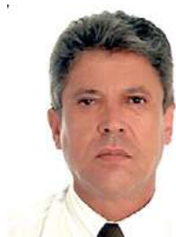
Texto de: Lucimar Gonçalves de Souza

A abertura de uma agência na cidade de Uberlândia sempre foi o desejo do SICOOB ARACREDI, porém, a proximidade regional e relação de negócios propiciavam o atendimento através de nossa estrutura em Araguari às comunidades e associados com propriedades rurais e negócios entre as duas cidades.