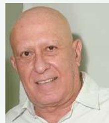
Texto de: Clayton Lemos da Silva

Depois de oito trimestres em recessão, ainda não chegamos ao fundo do poço. Os consultores e analistas econômicos agora transferiram esse estágio para os dois primeiros trimestres de 2017.