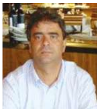
Texto de: Marcos S. Figueiredo

2016... que ano!!! O que se aprende melhor é o que se vive. Dizem. E nesse... ahhhh... Quanto "Aprendizado".