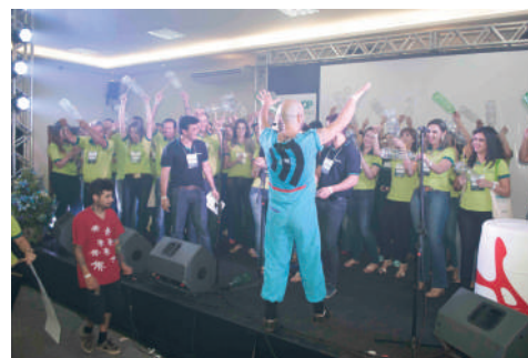
LIDERAR SIGNIFICA COORDENAR TALENTOS