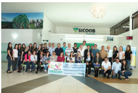
Lançamento dia de Cooperar 2014