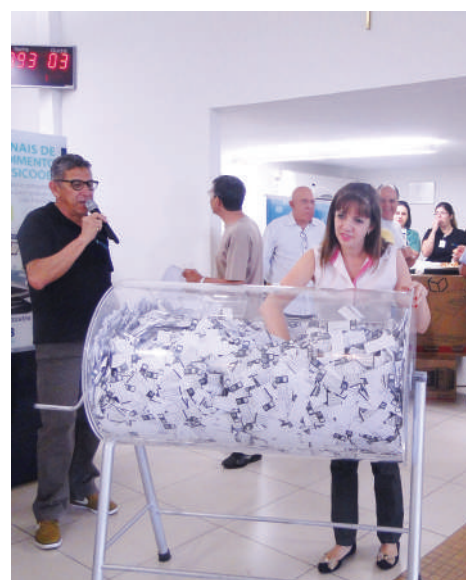
Hora do sorteio.