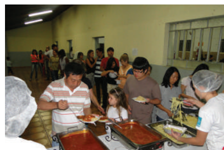
Noite do macarrão - Arrecadação de recursos