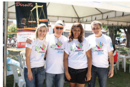
Orientação jurídica a pessoas de baixa renda