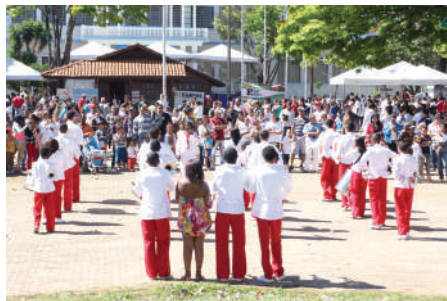
Fanfarra Escola José Carneiro da Cunha