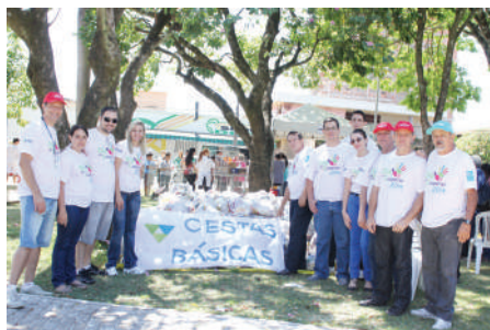
Distribuídas 540 cestas básicas