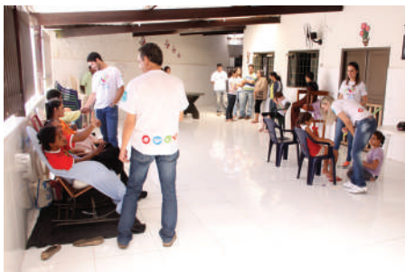
Casa do Caminho