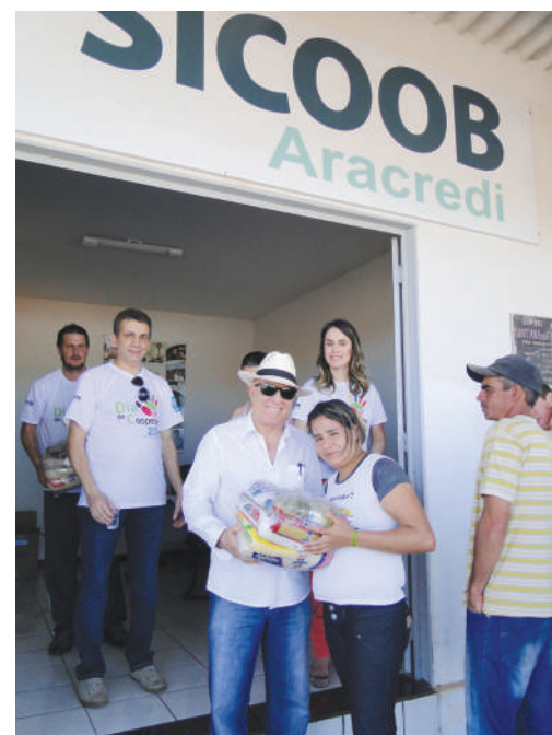
Indianópolis - MG

Quem passou pela praça Getúlio Vargas no centro da cidade, percebeu um cenário bem diferente. Diversas ações aconteciam em prol do "Dia C" - Dia de Cooperar, num clima de solidariedade e cooperação. Os que ali estiveram puderam apreciar as diversas atividades como apresentações musicais com Bandas e Artistas locais, Professores e alunos do Conservatório do Municipal de Araguari-MG, Rua de