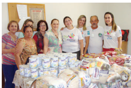
Doações - "Semente esperança" - Cestas básicas e Nutren