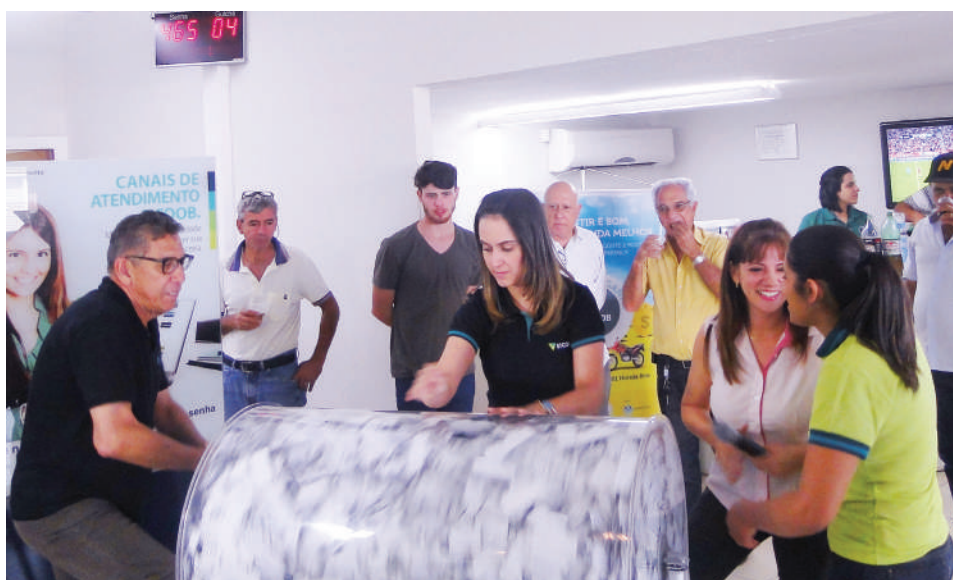
Sorteio é dia de confraternização