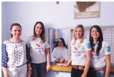
Doação Medalha Milagrosa