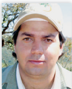
por Sidney A. Peroco Consultor

Mal se encerrou a safra 2014 e a 2015 já está a todo vapor, produtores com ânimos renovados com as perspectivas de bons preços para a próxima safra e também com a chegada das chuvas, que atrasaram, mas chegaram em quantidade satisfatória.