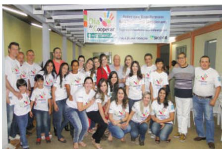
Voluntários - Noite do macarrão - Arrecadações