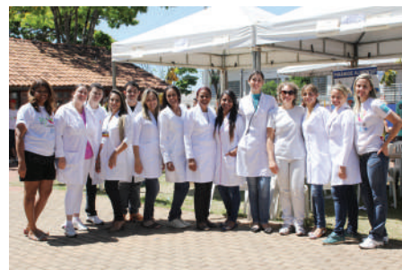
UNIPAC - Alunos e professores