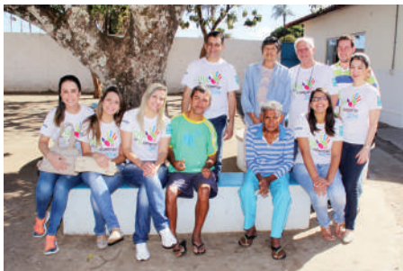
Asilo São Vicente de Paula