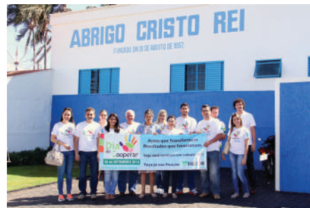
Doações de toalhas, lençóis.