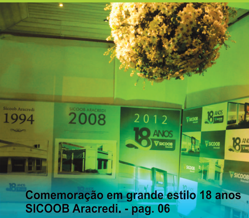
Comemoração em grande estilo 18 anos SICOOB Aracredi. - pag. 06