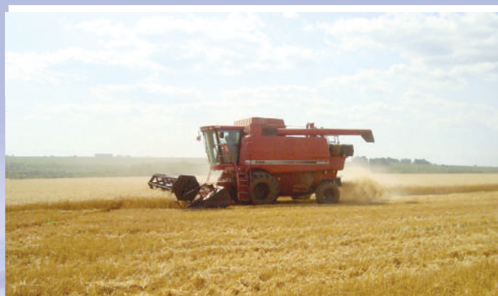
Colheita de trigo