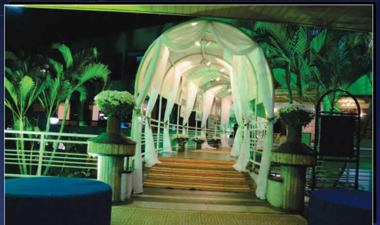
Túnel do tempo