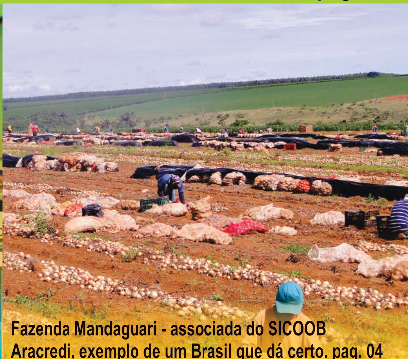
Fazenda Mandaguari - associada do SICOOB Aracredi, exemplo de um Brasil que dá certo. pag. 04