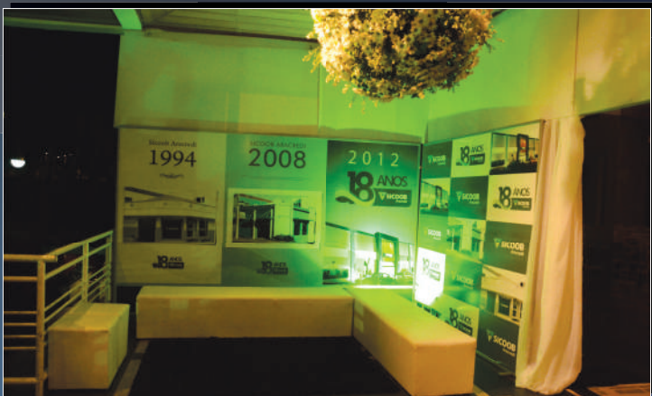
Painel destacando a evolução de suas sedes