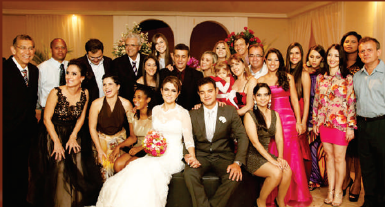
A família Aracredi exaltando os noivos