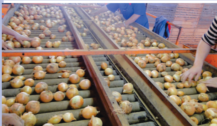
Produção é selecionada na própria fazenda