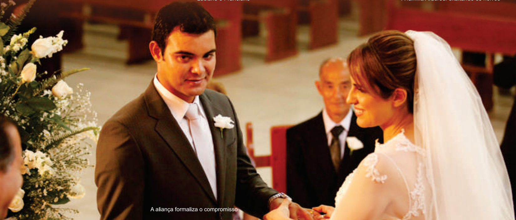
A aliança formaliza o compromisso