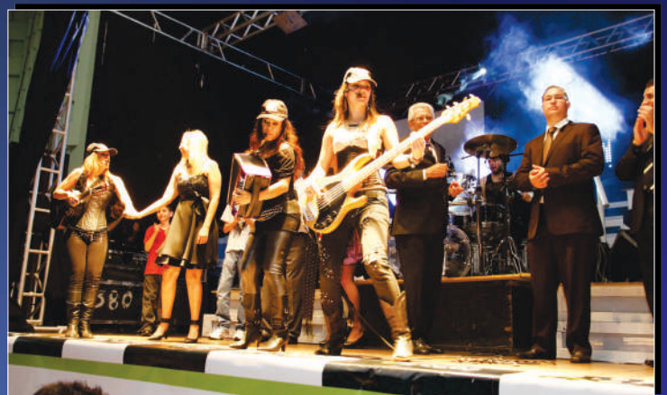
Banda Barra da Saia