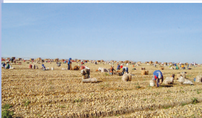
Colheita de cebola