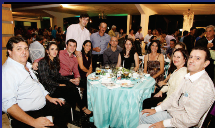
A confraternização foi o ponto alto da festa