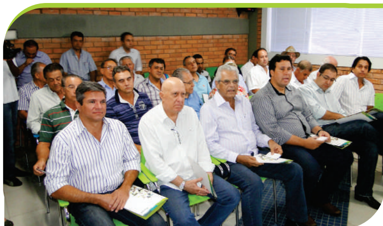
Convidados para o “Encontro com associados”