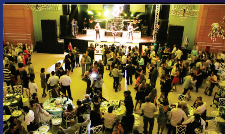
"Quem não dança, cede a dama"