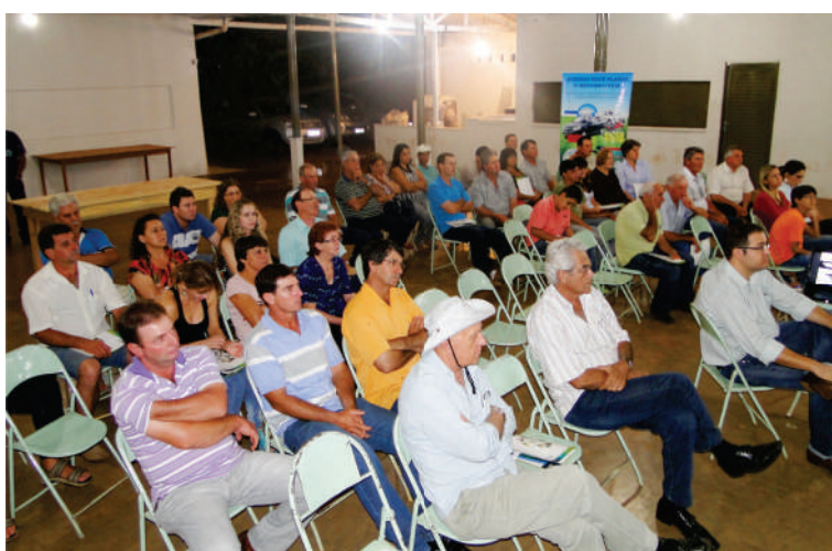
Participantes do Encontro

Matriz: (34) 3242-7677 Rua Brasília, 300 Armazenagem para BM&F Serviço de rebenefício Depósito em BAG