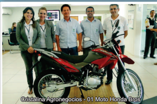
Cristalina Agronegocios - 01 Moto Honda Bros