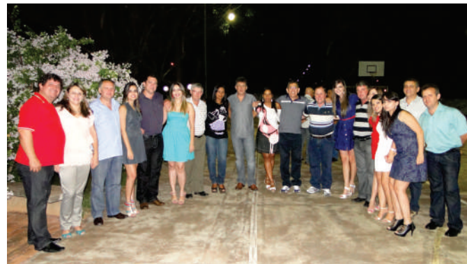
Um jantar de confraternização com a participação dos funcionários e conselheiros do SICOOB Aracredi, realizado no Condomínio Panorama, marcou com chave de ouro o encerramento da visita dos dirigentes do SICOOB CrediCanoinhas-SC.