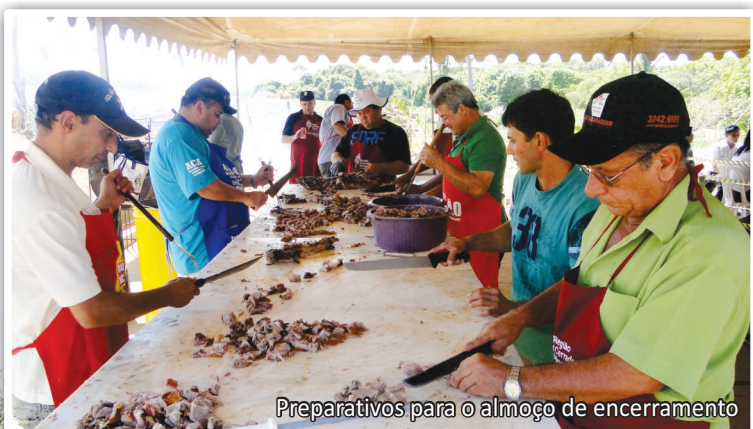
Preparativos para o almoço de encerramento