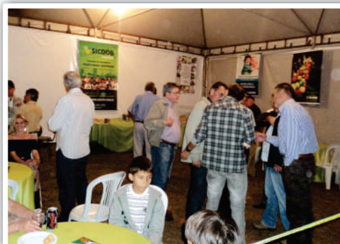
Vista geral do stand SICOOB Aracredi