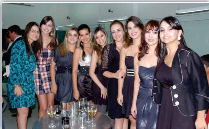
A graciosa e competente equipe da Aracredi