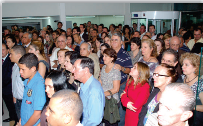
Os Associados prestigiaram a inauguração da nova sede