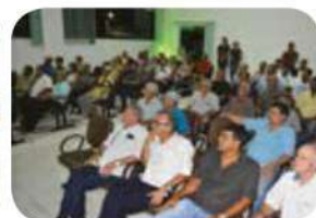
São Geraldo do Baixio