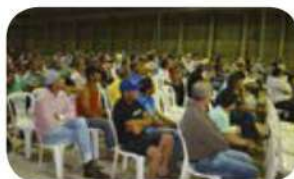
São José do Itueto