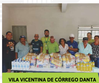
VILA VICENTINA DE CÓRREGO DANTA