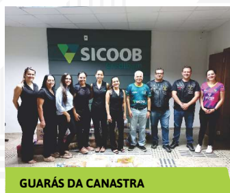
GUARÁS DA CANASTRA