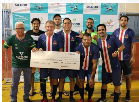
Vice-campeão: Tapiraí United