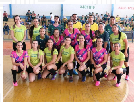
Jogo amistoso futebol feminino Sicoob Credibam