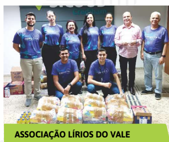
ASSOCIAÇÃO LÍRIOS DO VALE