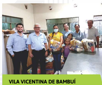
VILA VICENTINA DE BAMBUÍ