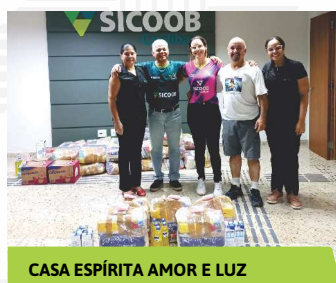
CASA ESPÍRITA AMOR E LUZ