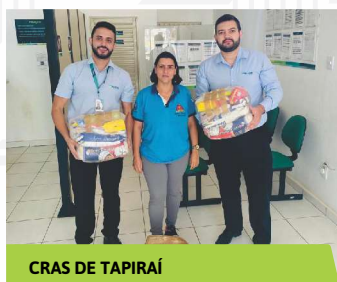
CRAS DE TAPIRAÍ