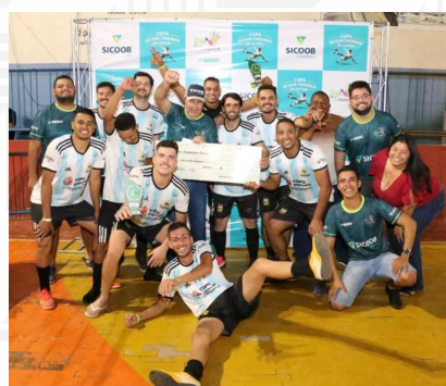
Campeão: Fuzarca Futebol Clube

Com a realização do evento conseguimos arrecadar 110 cestas básicas e beneficiarmos as seguintes instituições: