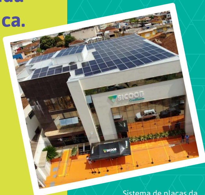
Sistema de placas da agência Bambuí gera energia limpa para três agências.

Uma ação importante de responsabilidade ambiental foi a implementação de placas fotovoltaicas na agência matriz em Bambuí, que é sustentável, gerando energia limpa para o próprio consumo e para as agências de Córrego Danta e Tapiraí. Com relação a agência Medeiros, ela tem o seu próprio sistema de energia fotovoltaica e gera sua própria energia.