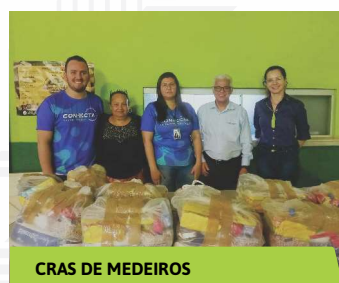
CRAS DE MEDEIROS