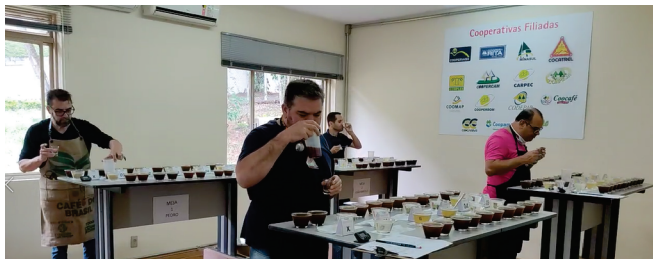
Juizes da Cooperativa Central de Cafeicultores e Agropecuaristas de Minas Gerais, - COCCAMIG, realizam a prova das 56 amostras enviadas para o II Concurso, promovido pelo Sicoob Credialto.

Obrigado a todos os que toparam participar, e parabéns aos melhores classificados!