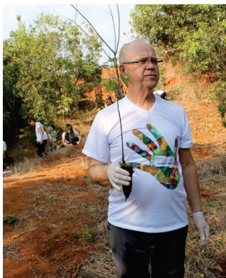
Atitudes simples podem transformar o planeta.