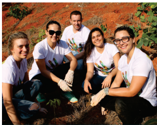
Voluntários Transformadores colocando a mão na massa.