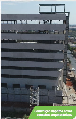
Construção imprime novos conceitos arquitetônicos.