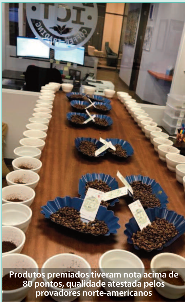
Produtos premiados tiveram nota acima de 80 pontos, qualidade atestada pelos provadores norte-americanos

Para a edição de 2020, o panorama é diferente. O concurso, que passa a se chamar “Xícara de Excelência”, por se tratar de cafés especiais da região do Alto São Francisco, tem sido estruturado para ser lançado mais cedo, em abril. A entrega das amostras está prevista para junho, julho e agosto, período que coincide com a colheita na região. Ao todo, a região produz algo em torno de 1 milhão de sacas/ano.