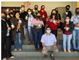
Capacitação de professores do município de Dorsoópolis sobre como utilizar as várias ferramentas para a realizar aulas online, durante a pandemia