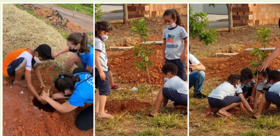
Mudas são plantadas por crianças das escolas, em parceria com o Rotary Club de Piumhi