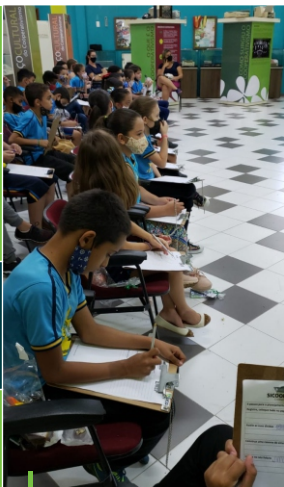
Atividade de contação de histórias, com a participação dos alunos da Escola Cel. Fidélis, de Piumhi