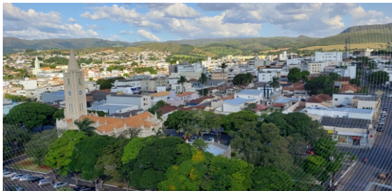
Vista parcial da cidade de Piunhi, a partir do terraço da nova sede do Sicoob Credialto, na Rua Miguel Couto.