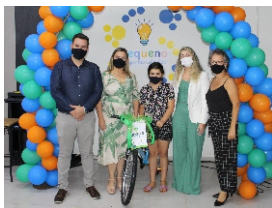
Aluna do projeto Pequeno Empreendedor ganhou uma bicicleta do Sicoob Credialto, durante encerramento do curso no município de Capitólio.