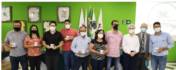
Concurso destaca o potencial e a qualidade dos cafés especiais produzidos na região do Alto São Francisco