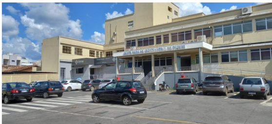
Santa Casa de Piumhi, importante hospital regional, contará com patrocínio do Sicoob Credialto