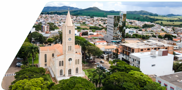
Vista parcial da cidade de Piumhi, com visualização do ECCO - Espaço Credialto de Conexões.