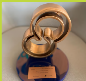
Troféu de premiação na categoria Comunicação e Difusão do Coop.

BRONZE CATEGORIA COMUNICAÇÃO E DIFUSÃO DO COOP.