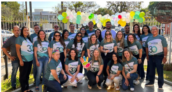
Cooperadores do Sicoob Credialto voluntários no Dia C de Cooperar 2022

O Dia C de Cooperar 2022 foi realizado no período de 02 de julho a 26 de julho, através do desenvolvimento de uma peça teatral, que promoveu aos cooperados, cooperadores e comunidade a percepção da importância da vivência do comportamento accountable para construção de uma cultura cooperativa, solidária e com prontidão para o voluntariado na vida cotidiana.