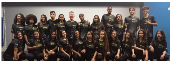
Grupo de Teatro Unique 7 do Sicoob Credialto

Com abrangência nacional, o dia C de Cooperar 2022 teve como tema: “Atitudes simples movem o mundo” para incentivar iniciativas de responsabilidade social nas comunidades em que as cooperativas estão inseridas por meio de ações voluntárias.