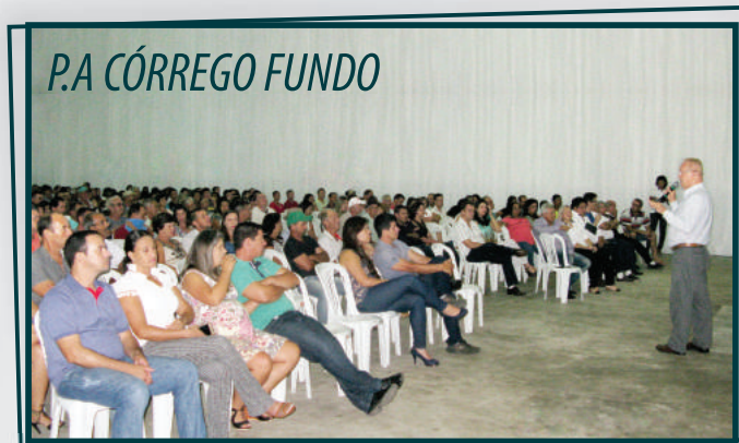
P.A CÓRREGO FUNDO