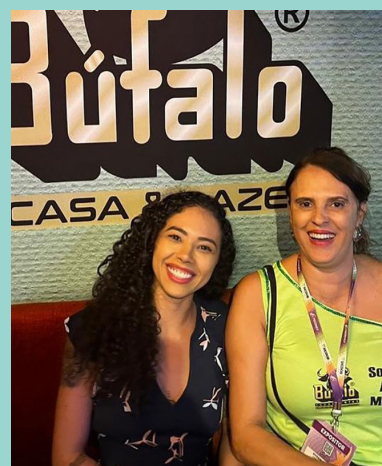
Empresa Búfalo Ferramentas ▲