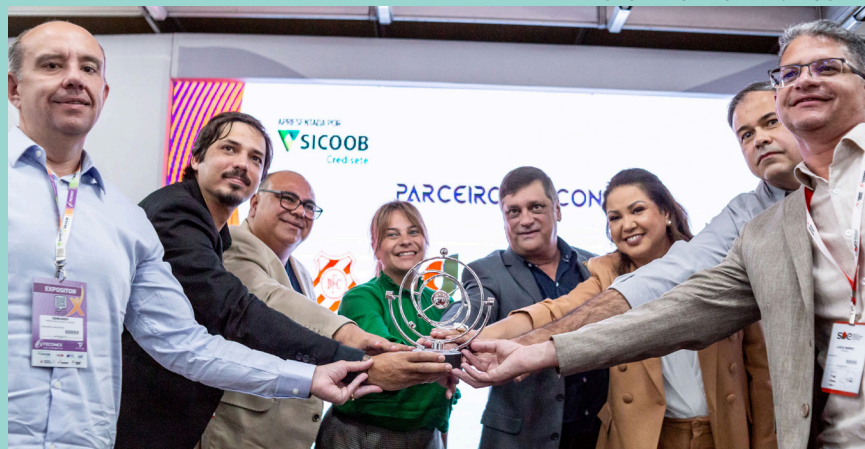
Representantes do Grupo UAI, CDL, ACI, Prefeitura, Governo do Estado e do patrocinador Master Sicoob Credisete, na abertura da terceira edição da Feconex