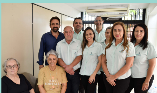
Colorado Empreendimentos ▲