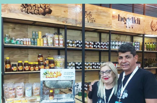
Empresa Favo de Mel ▲