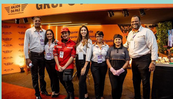
Empresa Anjos da Paz ▲