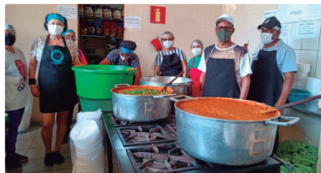
Voluntários preparando a deliciosa refeição na cozinha da barraquinha de São Geraldo