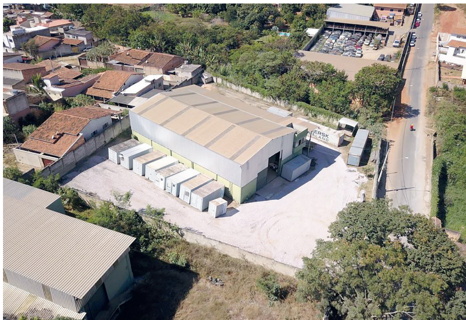
Sede da Conterloc fica na rua Rosa Clara Oliveira, 1213, bairro Manoa

“Acreditamos que o nosso grande diferencial e fator de excelência é esta atuação exclusiva. Além disso, conseguimos agregar muito bem o fator experiência de cada um dos sócios”.