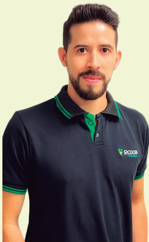
Roger passou por outras funções, mas atualmente é auxiliar de gerente