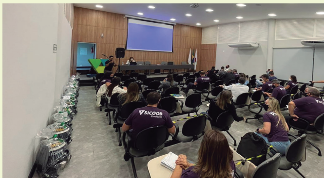
Reunião seguiu todos os protocolos de segurança da pandemia

Depois de mais de um ano, a reunião de trabalho dos gerentes foi presencial e apresentou o balanço do 1º semestre de 2021