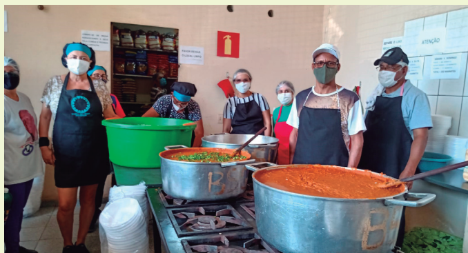
Projeto conta com a participação de mais de 100 voluntários

Projeto “Irmãos que Doam” oferece mais de 500 refeições por dia para pessoas necessitadas em Sete Lagoas