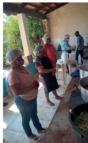
A cozinha "Casa de Sião" é uma expansão do projeto