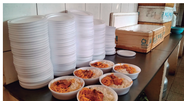
Projeto garante a entrega de mais de 500 refeições diárias em vários bairros de Sete Lagoas

Os alimentos podem ser entregues presencialmente na paróquia São Geraldo no horário de 7h às 13h, na rua Ricart Normand 261, bairro São Geraldo em Sete Lagoas