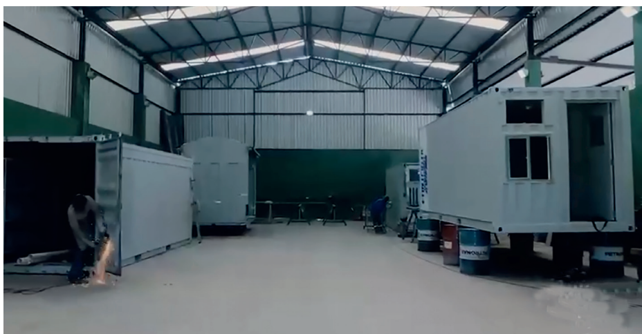
Oficinas da Conterloc com instalações para atender todo tipo de demanda

No caso de aluguel, o contêiner também se destaca pela sua praticidade já