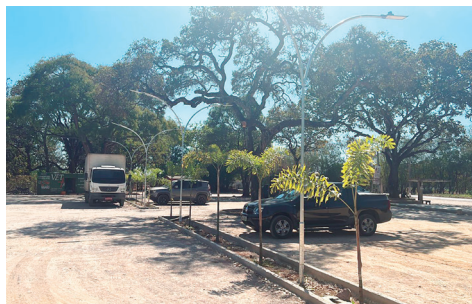
Projeto já promoveu várias melhorias e vai criar uma agradável área de convivência