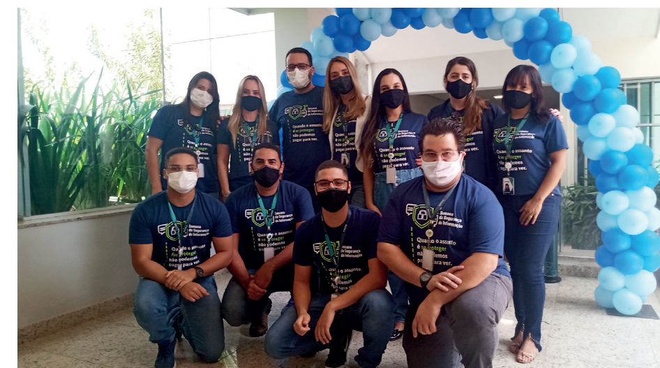
Equipe administrativa coordenou os eventos durante toda a semana

coob Credisete busca levar formação, informação e educação aos associados e com isso mantém constante apoio à comunidade em geral”, comentou. A Semana de Segurança da Informação faz parte do plano estratégico do Sicoob Credisete. Ações são realizadas durante todo o ano provando a responsabilidade da cooperativa em todos os níveis de sua gestão. “O mundo está em constante transformação e neste cenário é preciso estratégia, planejamento com foco na otimização de processos e soluções tecnológicas”, destacou a gerente Administra-