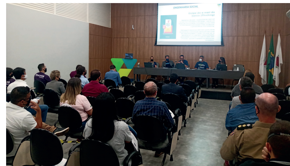
Evento realizado no auditório do Centro Administrativo integrou a programação