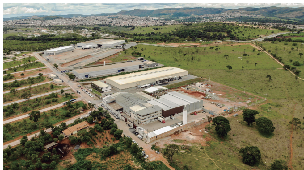
Fábrica da Gellak, em Sete Lagoas, é uma das mais estruturadas do setor em MG

Iniciei minha trajetória aos 13 anos de idade trabalhando com aparelhos de refrigeração. Nesta profissão, fui trabalhar em Belo Horizonte com 17 anos. Depois de três anos, retornei para Sete Lagoas e abri minha própria empresa. O negócio dava certo e já estava com três funcionários, mas decidi mudar tudo. Foi uma loucura, mas nunca tive medo de enfrentar obstáculos. Parentes e pessoas próximas diziam que eu estava doido, mas em outubro de 1993 nasceu a Gellak.