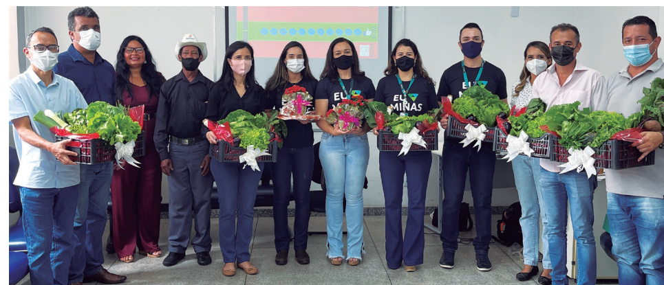
Projeto da horta envolve produtores e representantes de diversas entidades

Na dia 14 de dezembro, foi realizada mais uma etapa do projeto Cooperação e Desenvolvimento na Horta Comunitária, idealizado pelo Sicoob Credisete, que tem como foco o apoio aos produtores do bairro Nova Cidade. Desta vez, a pauta da reunião, ocorrida no auditório do 25º Batalhão da PM, foi a fertilidade do solo sob a coordenação da UFSJ.