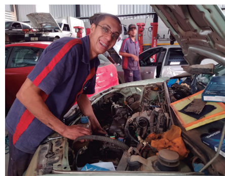
Centro Automotivo conta com equipe experiente e qualificada