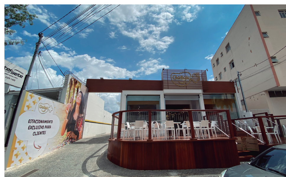
Nova loja conceito da Gellak está fazendo grande sucesso na região central