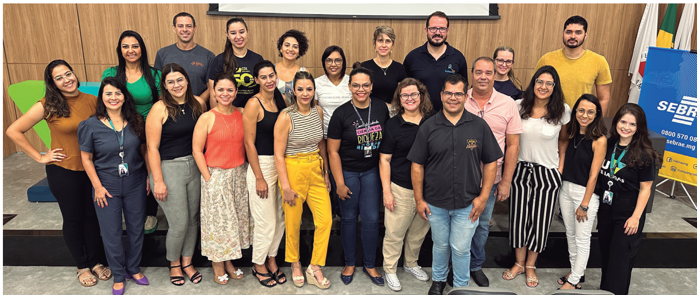
Parceria entre o Sicoob Credisete e o Sebrae oferece oportunidade de capacitação para empreendedores associados