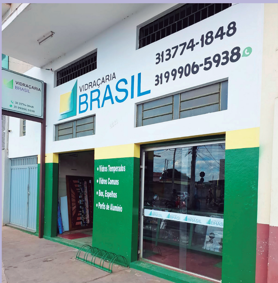
A empresa fica na rua Santa Juliana, 2.561, bairro São Vicente