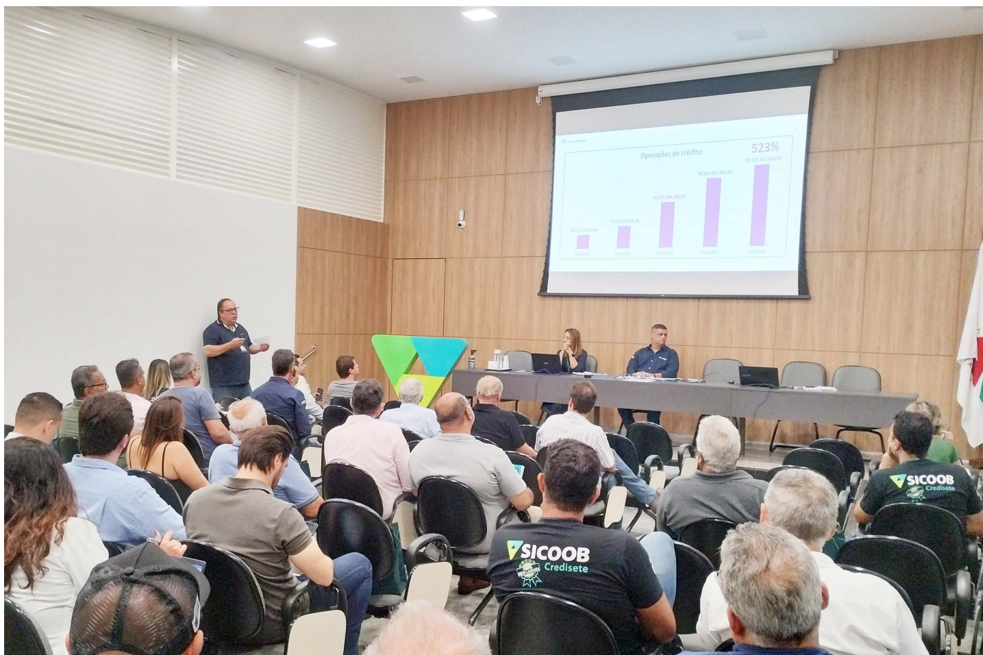
AGO foi realizada no dia 10 de março reunindo conselheiros, diretores, colaboradores e associados