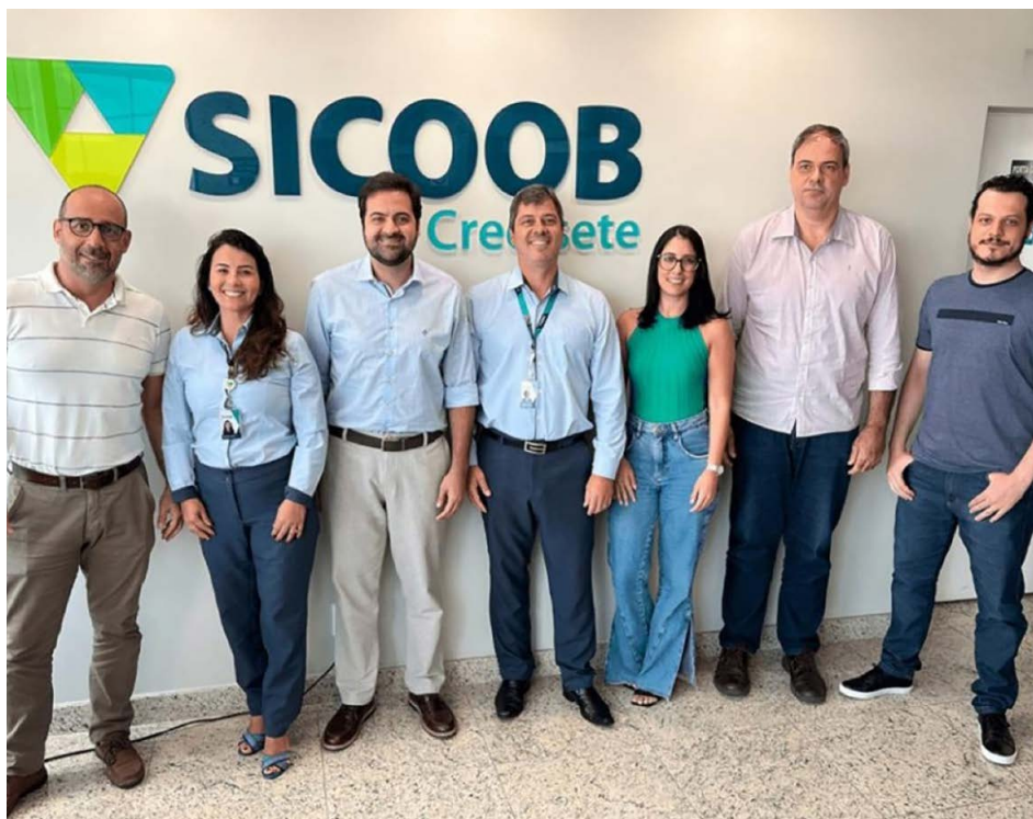
Reunião entre representantes do Sicoob Credisete e do Grupo Uai, um dos organizadores da feira, definiu a parceria que gera ótimas expectativas

Vivendo e participando do avanço da cidade, dia após dia nas últimas décadas, o Sicoob Credisete acredita que o município tem tudo para se transformar em um grande polo econômico regional. Por essa razão e por entender que a união faz a força, assim como no cooperativismo, a instituição se juntou a Feconex.