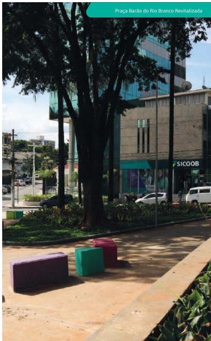
Praça Barão do Rio Branco Revitalizada