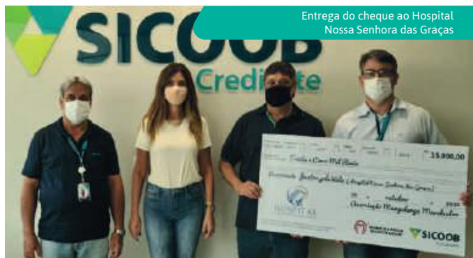
Entrega do cheque ao Hospital Nossa Senhora das Graças