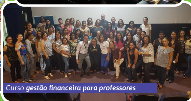
Curso gestão financeira para professores