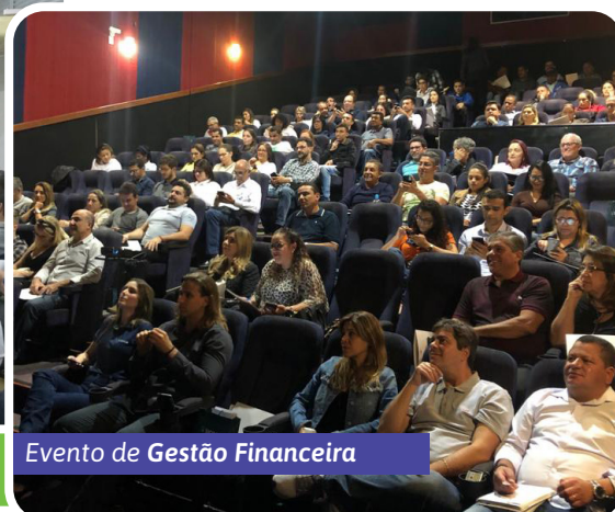
Evento de Gestão Financeira