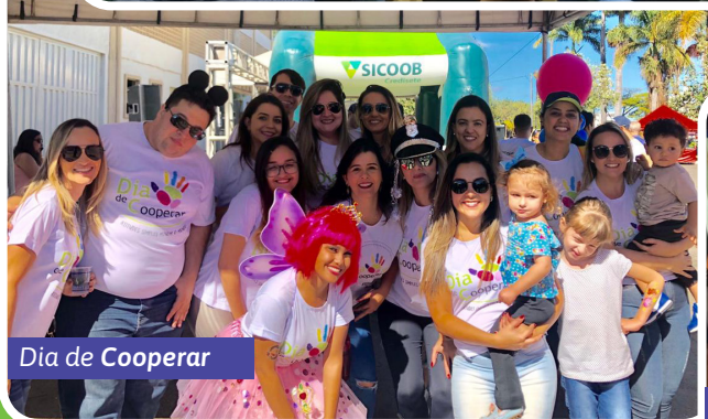
Dia de Cooperar