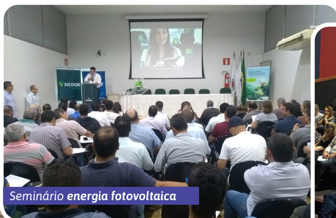
Seminário energia fotovoltaica

No decorrer de 2019, vários eventos foram realizados e estivemos presentes. São muitos momentos de alegria, aprendizado e cooperação, como estes que estão registrados abaixo: