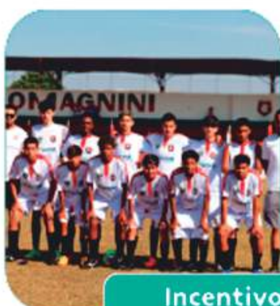
Incentivo ao Esporte