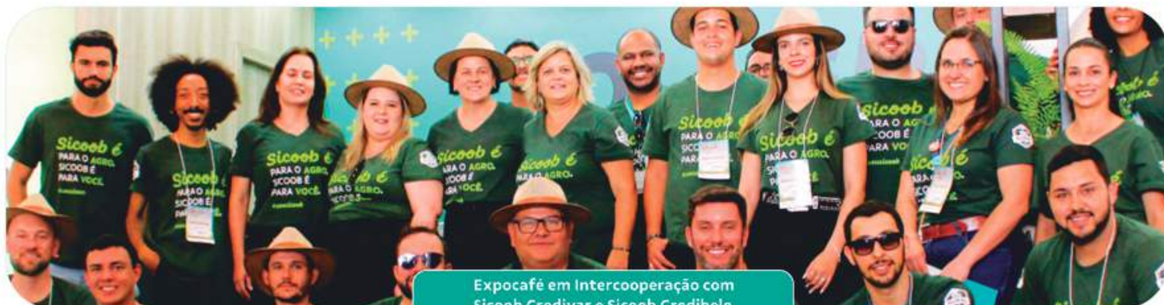
Expocafê em Intercooperação com Sicoob Credivar e Sicoob Credibelo