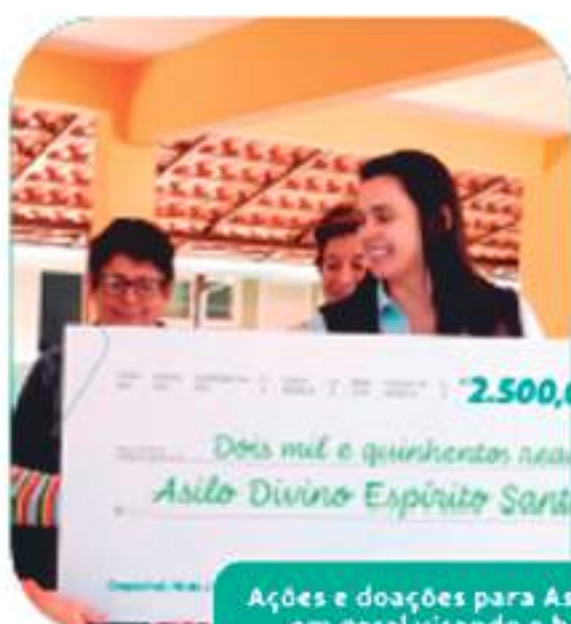
Ações e doações para Asilos, Santa Casa e população em geral visando o bem-estar da comunidade