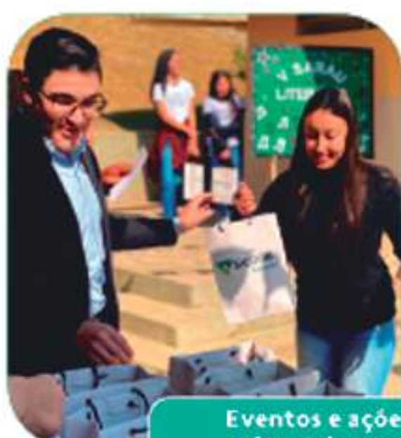
Eventos e ações que promovem a cultura, lazer e desenvolvimento