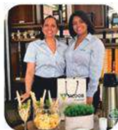
Presença na FECON 2024