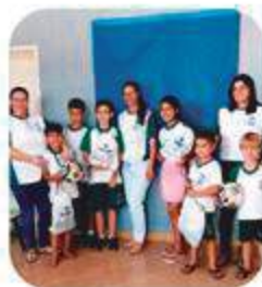
Incentivo ao Ensino