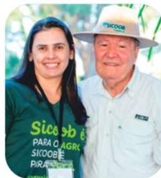
Encontros Agro SENAR, EMATER, EPAMIG, Pecuária de Corte e Dia de Campo