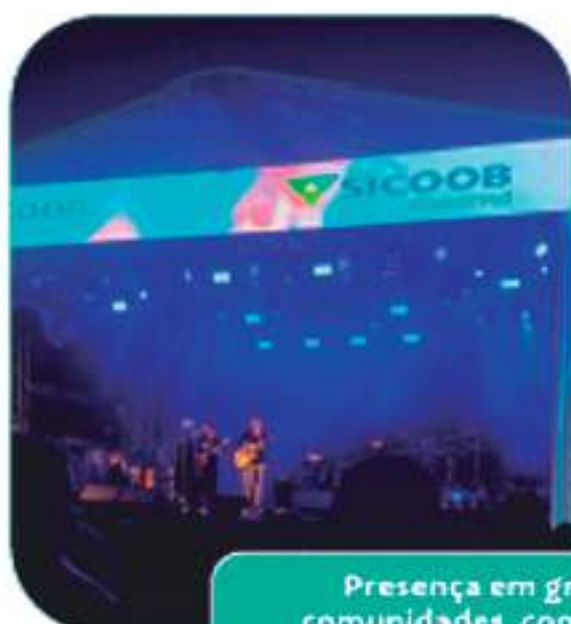
Presença em grandes eventos das comunidades, como Rodeios e Festivais