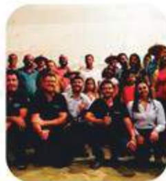
Parceria com Educação VERBAE, Associação As Cafexeiros do Hortoquero e comunidades rurais