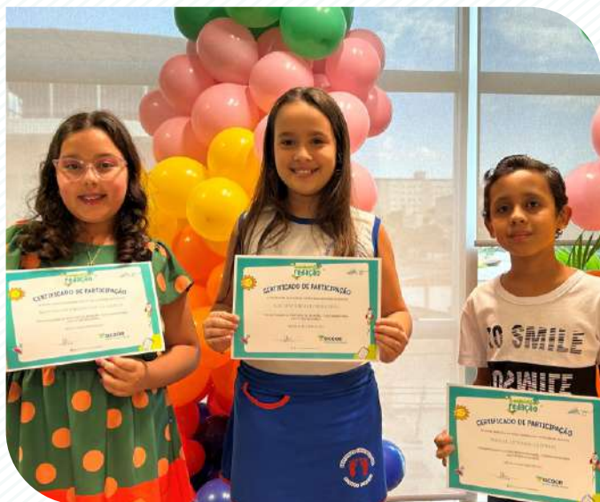
Premiados da cidade de Arcos