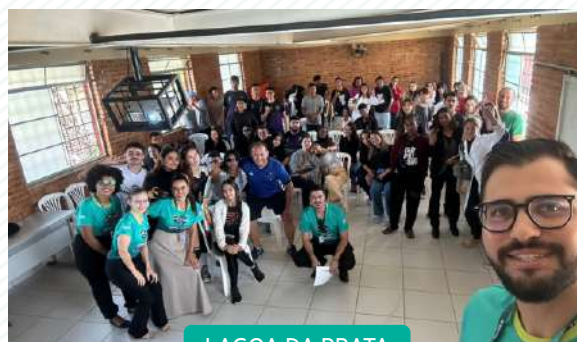
LAGOA DA PRATA

A certificação no Evolua não é apenas uma conquista acadêmica, mas uma preparação para a vida prática. Os alunos, agora mais preparados, têm as ferramentas necessárias para transformar seus sonhos em realidade, seja abrindo seu próprio negócio, liderando equipes ou ajudando a fortalecer a economia local por meio da colaboração e do cooperativismo.