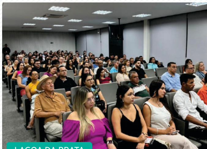
LAGOA DA PRATA