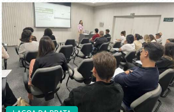
LAGOA DA PRATA

O evento foi uma oportunidade única para os associados do Sicoob União Centro-Oeste aprenderem com especialistas como alavancar suas marcas no ambiente digital. Com a presença crescente das redes sociais no cotidiano dos consumidores, os empreendedores entenderam a importância de se adaptarem às novas demandas do mercado digital, não apenas para atrair novos clientes, mas também para fidelizar os já existentes, utilizando estratégias eficazes de engajamento e relacionamento.