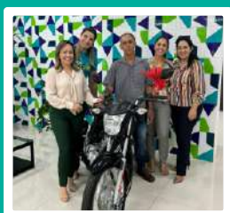
1 Moto 0Km para Lagoa da Prata