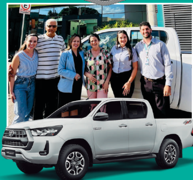
1 Hilux 0Km para cooperada de Arcos!