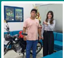
1 Moto 0Km para Esteios

Em 2024, o Sicoob União Centro-Oeste celebrou 35 anos de história com uma campanha especial, repleta de surpresas e prêmios para seus associados. A campanha "Sicoob União Centro-Oeste: Há 35 Anos com Você" foi um verdadeiro marco na trajetória da cooperativa, promovendo não apenas a celebração de seu aniversário, mas também a proximidade e o agradecimento aos associados que fizeram parte dessa caminhada.