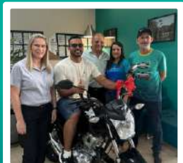
1 Moto 0Km para Pains