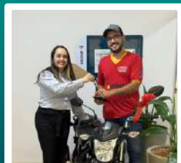
1 Moto 0Km para Moema