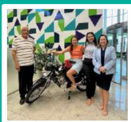
1 Moto 0Km para Arcos