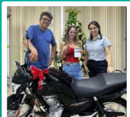
1 Moto 0Km para Japaraíba