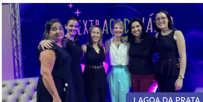
LAGOA DA PRATA