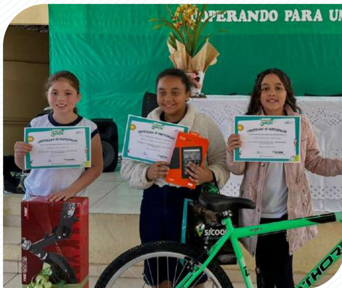
Premiados da cidade de Pains

No mês de março de 2024, o município de Arcos e de Pains foram palco de um evento educativo marcante, que uniu aprendizado e diversão em uma jornada de transformação para alunos e educadores. Com o tema “Cooperando para um futuro brilhante”, o encontro teve como objetivo promover a reflexão sobre cooperativismo, educação financeira e sustentabilidade, temas essenciais para o desenvolvimento de cidadãos conscientes e preparados para os desafios do futuro.