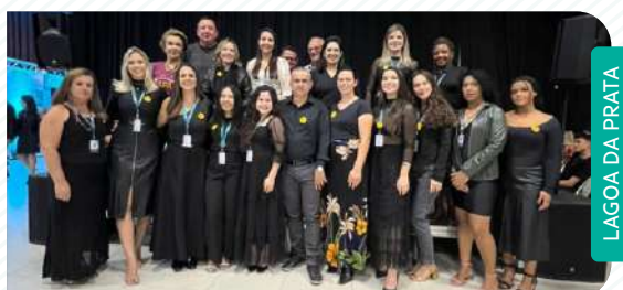
LAGOA DA PRATA

O sucesso de cada um desses eventos foi a prova de que, quando as pessoas se unem por uma causa maior, o impacto é imenso. O Dia de Cooperar é um exemplo claro de como o cooperativismo pode transformar realidades e criar uma rede de apoio que vai além das ações pontuais, gerando um impacto duradouro para todos os envolvidos.