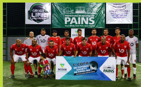
Pains Esporte Clube, campeão da 1ª Copa de Futebol Society de Pains-MG