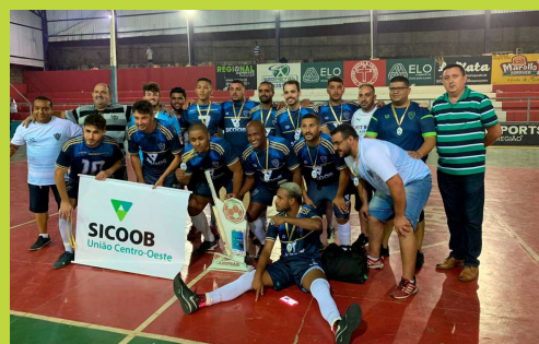
Ypiranga Esporte Clube, campeão da 1ª Copa Arcos de Futsal