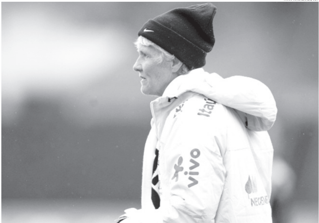
■ No Torneio Internacional da França, o Brasil encarou a Holanda, no Estádio Michel D’Ornano, em Caen (FRA)

Após a prática, a sueca concedeu entrevista coletiva de imprensa para os jornalistas