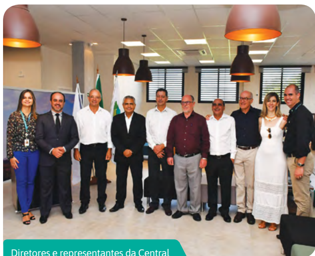
Diretores e representantes da Central Crediminas reunidos na agência