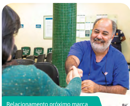
Relacionamento próximo marca os 21 anos da agência