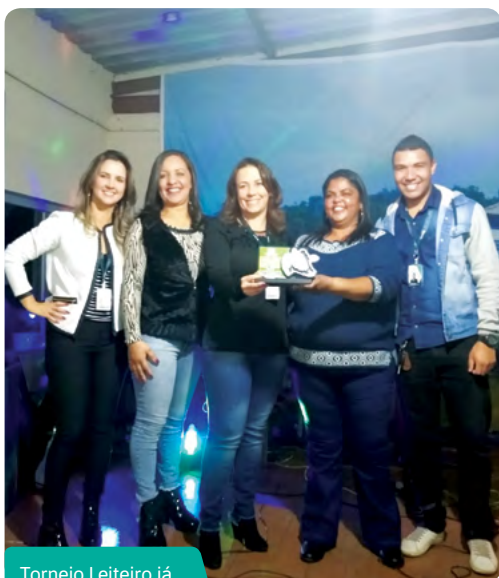
Torneio Leiteiro já é tradição na cidade

que eu vejo que o pessoal rural às vezes não dá tanta atenção para esse assunto. O encontro trouxe muita coisa importante para a gente”, conclui.