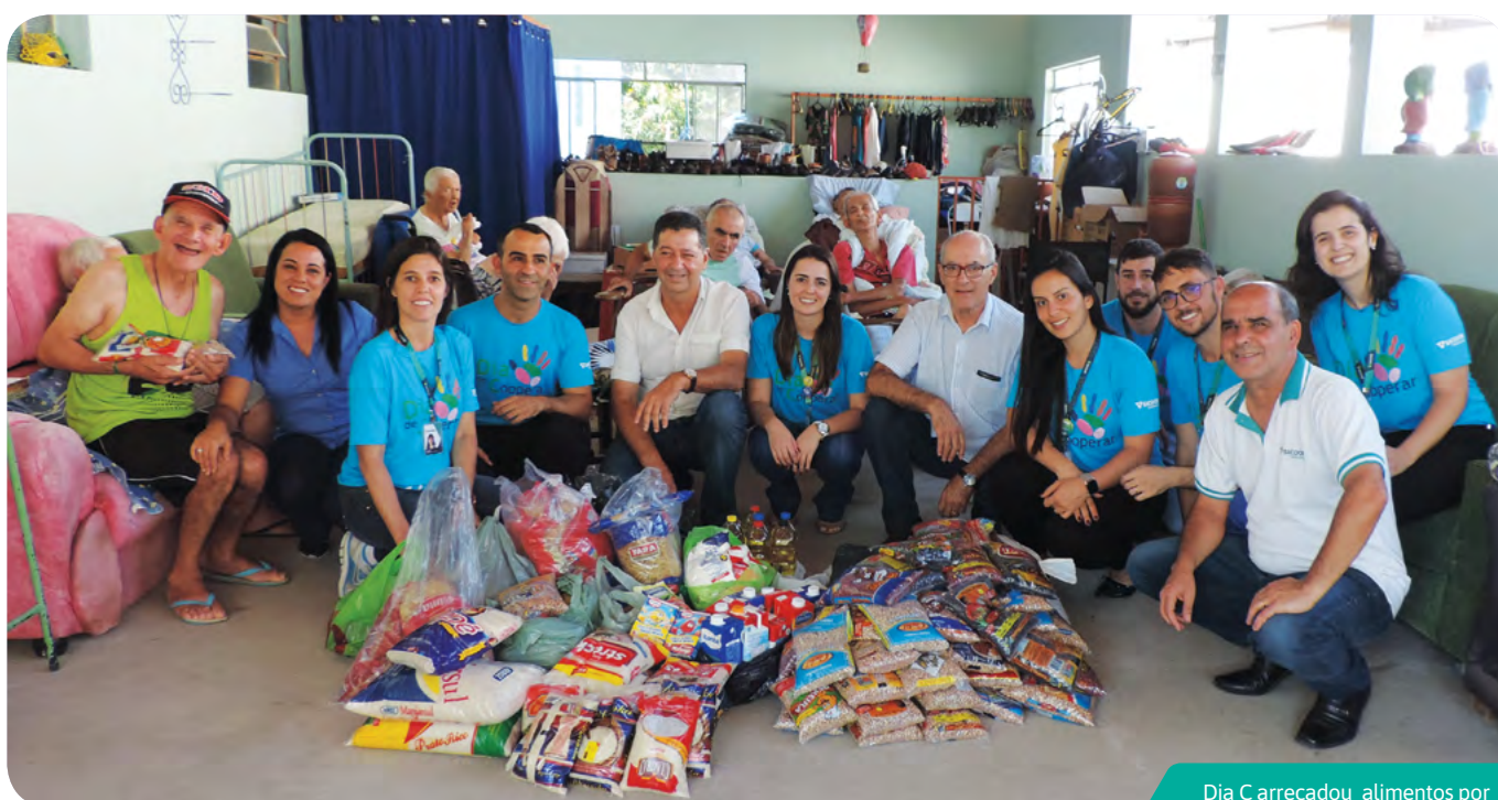
Dia C arrecadou alimentos por meio da Corrida Solidária