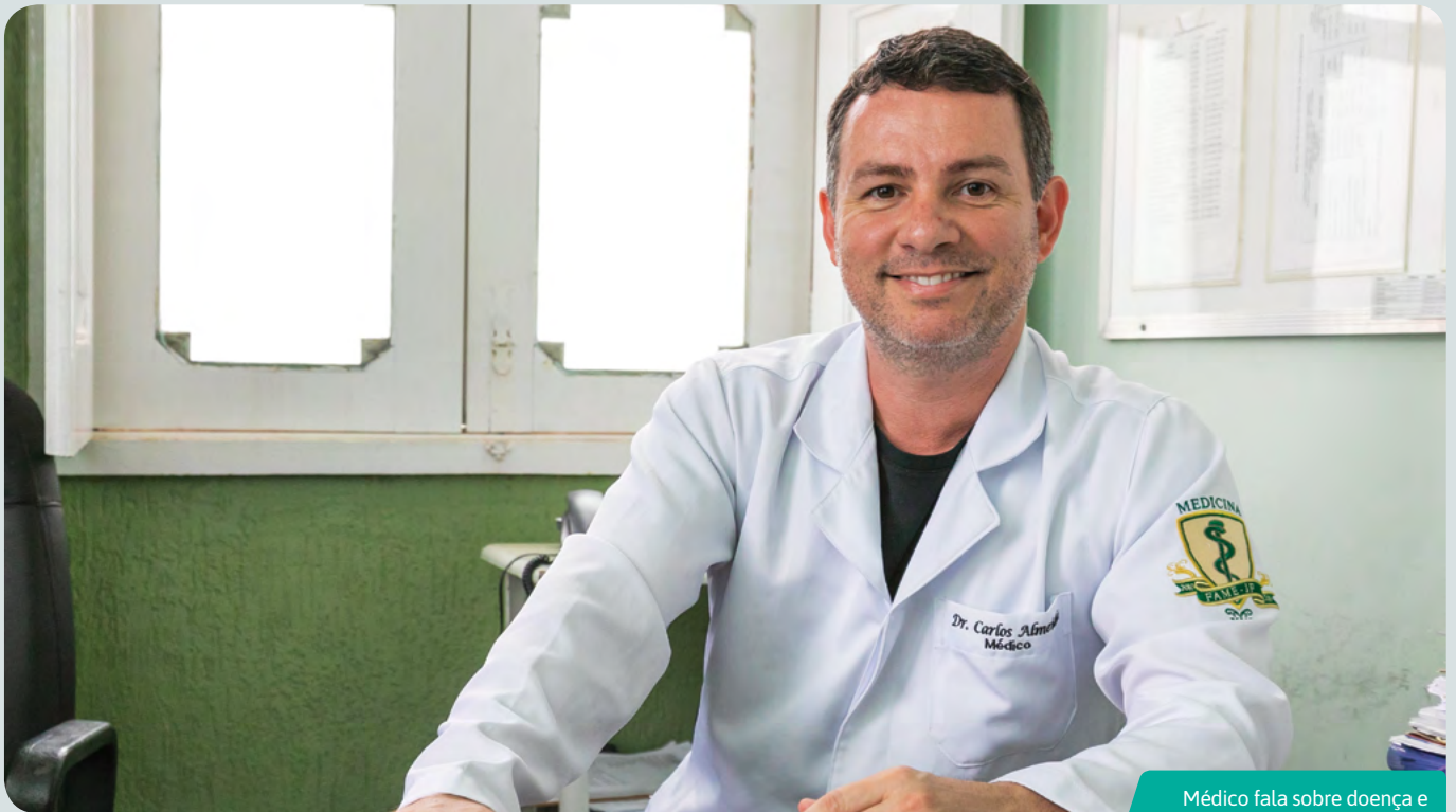
Médico fala sobre doença e destaca cuidados preventivos

O sarampo já é um surto novamente. Se o número absoluto de casos não parece alarmante, o consenso médico é de que, em casos de doença considerada erradicada, um único caso já é considerado epidêmico. A prevenção, nesse caso, é o único modo de evitar que o sarampo volte a se alastrar.