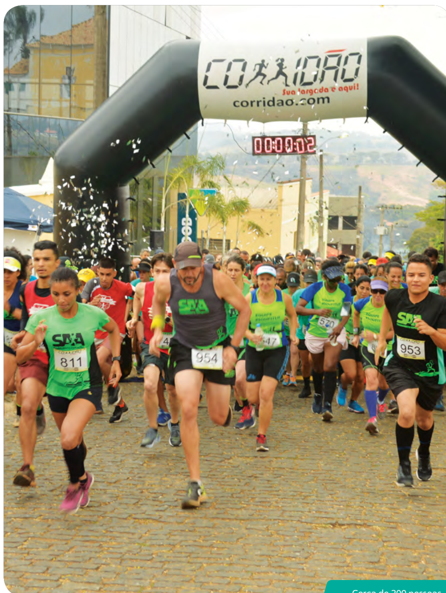
Cerca de 200 pessoas participaram da corrida

Para ajudar e também ganhar um incentivo extra na hora de correr, Solange Aparecida Ferreira, funcionária do Sicoob Credicampo, levou