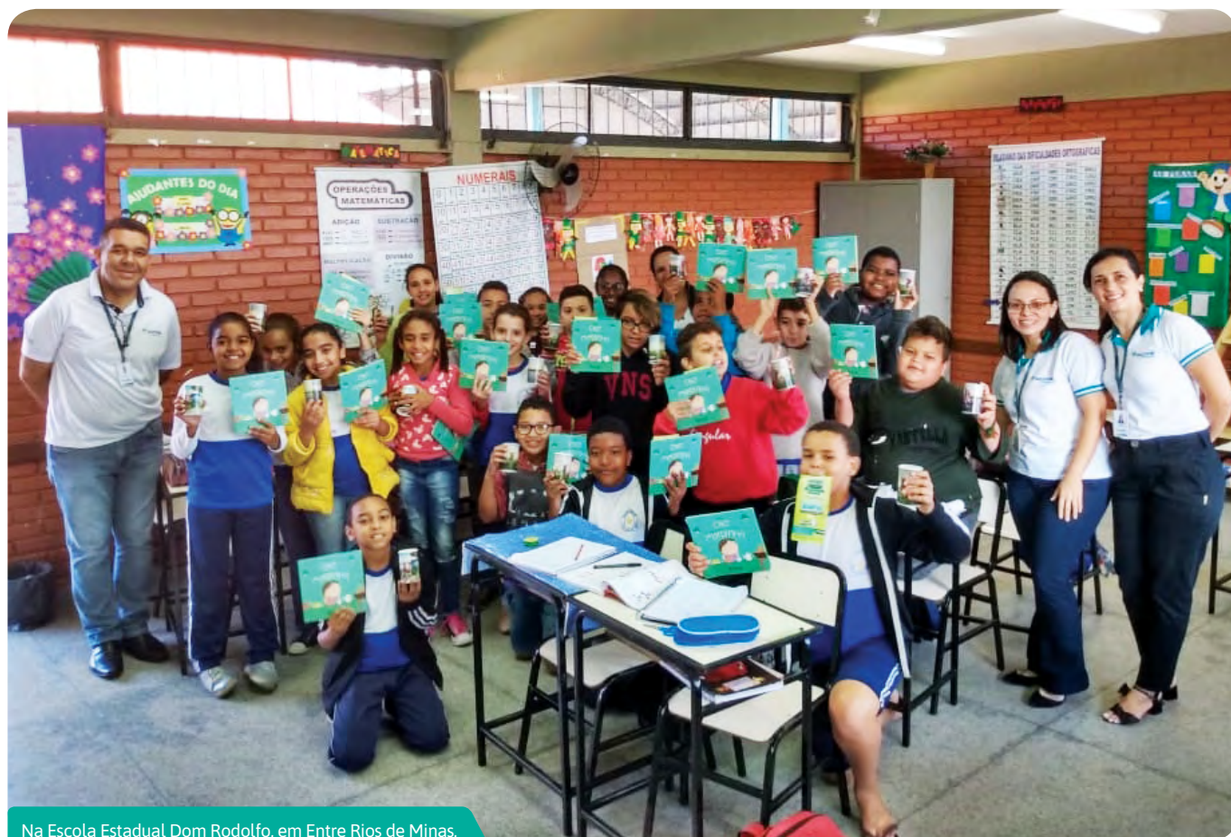
Na Escola Estadual Dom Rodolfo, em Entre Rios de Minas, crianças aprendem a lidar com o dinheiro em sala de aula

Que escola é lugar de aprendizado, isso todo mundo já sabe. Mas, muito mais do que apenas ensinar a grade curricular, é preciso preparar crianças e adolescentes para a vida. Pensando nisso, o Sicoob Credicampo criou um projeto para levar educação financeira para escolas das cidades onde há unidades da cooperativa. Uma delas é a Escola Municipal Cristiano Otoni, onde o trabalho foi feito com alunos de 4° e 5° anos.